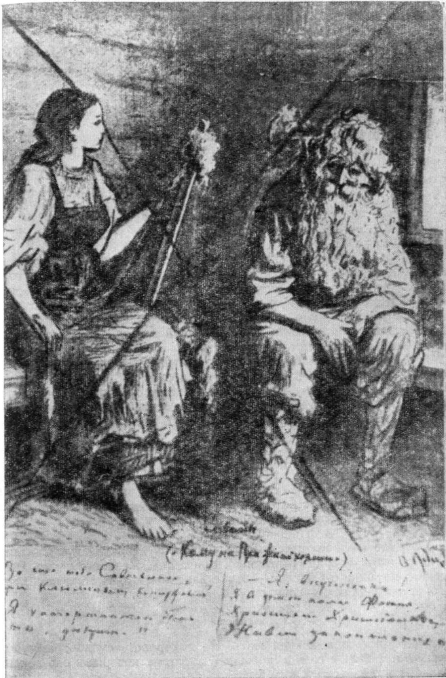
Савелий и Матрена Тимофеевна, Рисунок А. Лебедева, перечеркнутый цензором