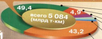
СТРУКТУРА ПАССАЖИРОБОРОТА по видам транспорта общего пользования (%)