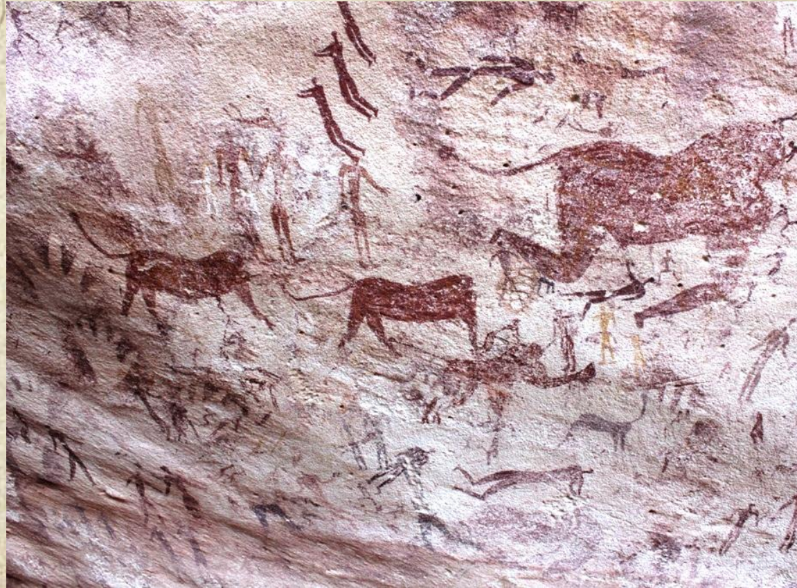
Фауна и первобытные люди Северной Африки времён неолита. Пещера Зверей, Египет.