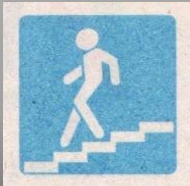
Подземный пешеходный переход