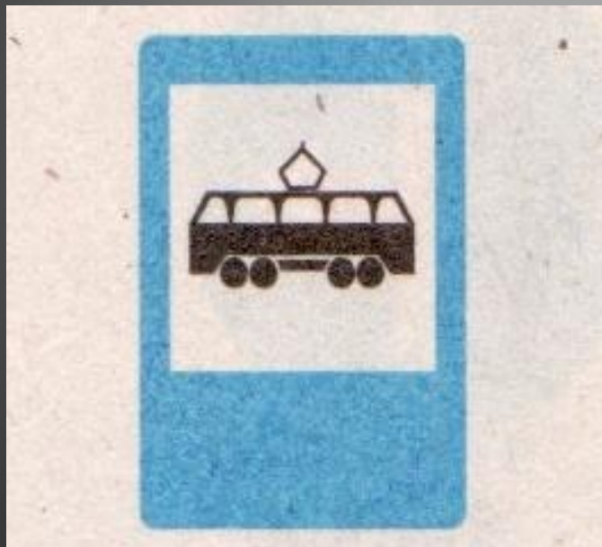
Место остановки трамвая