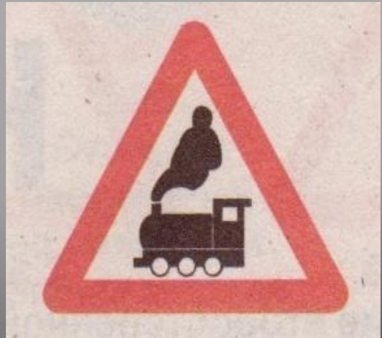
Железнодорожный переезд без шлагбаума