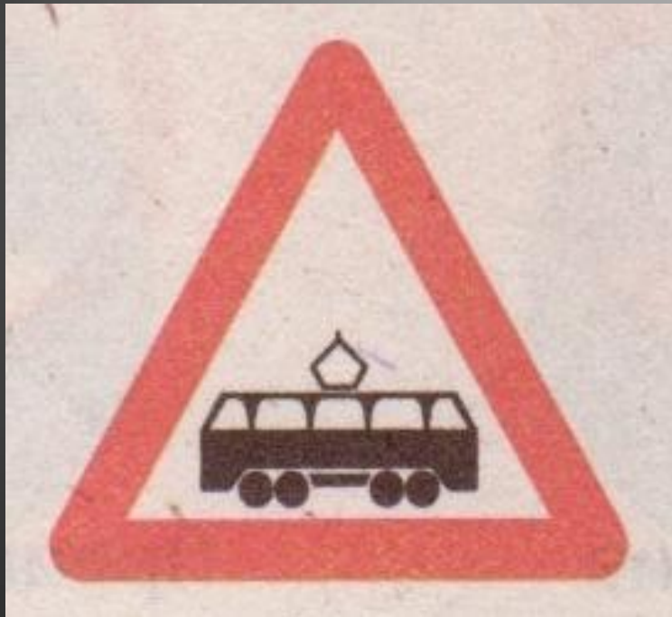
Пересечение с трамвайной линией