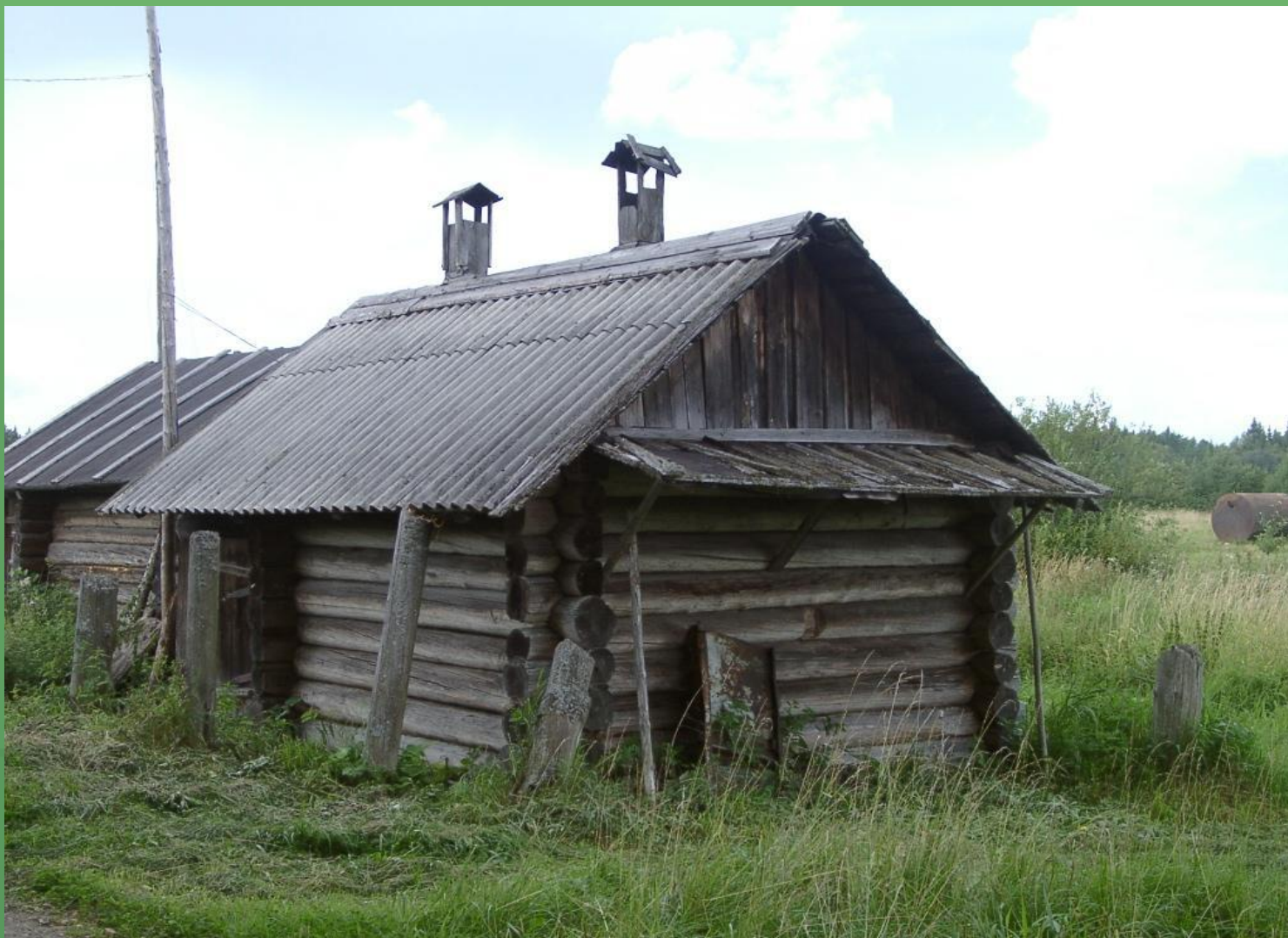
д. Нижняя, баня.