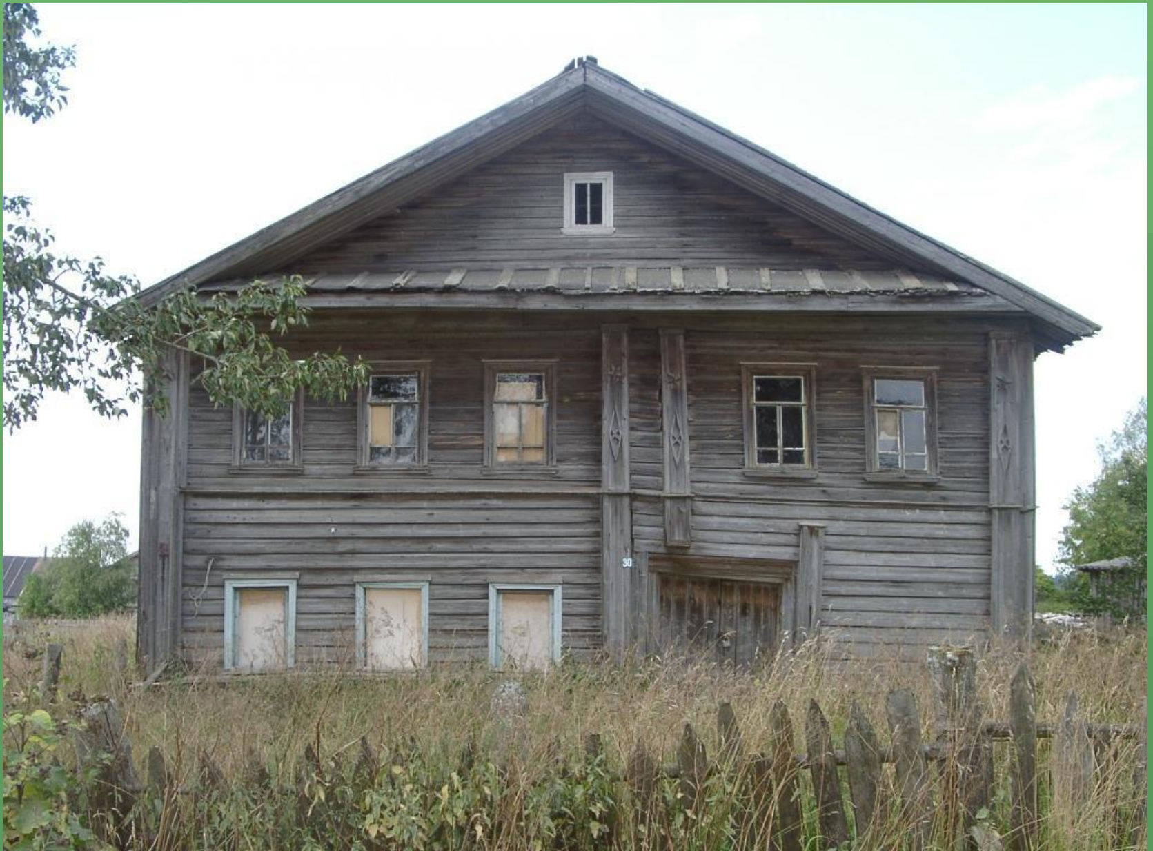
д. Савинская. Двухэтажный дом.