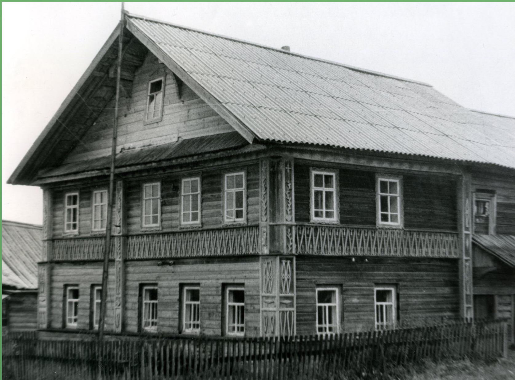
д. Заберезник. Двухэтажный дом. 1986 год.