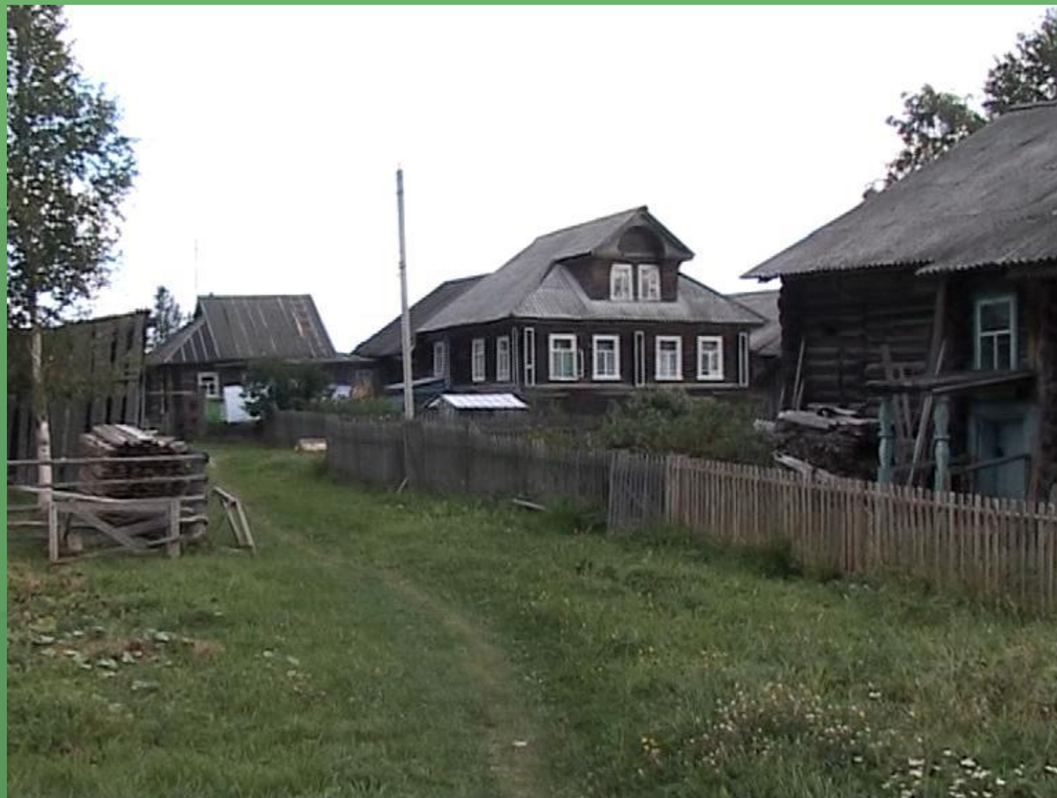
д. Нижняя. Рядовая планировка деревни.