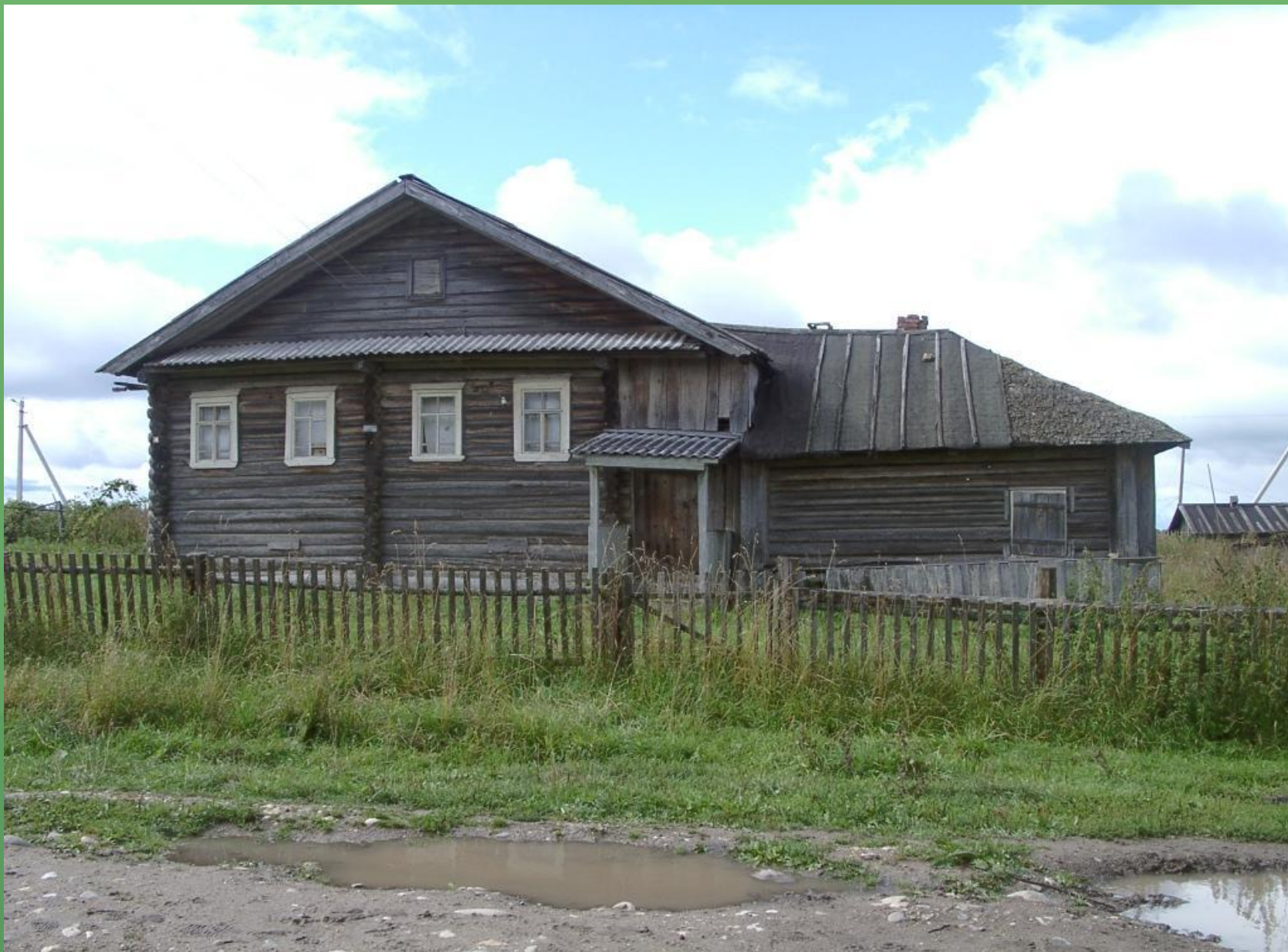
д. Борисово. Дом – пятистенок с зимовкой.