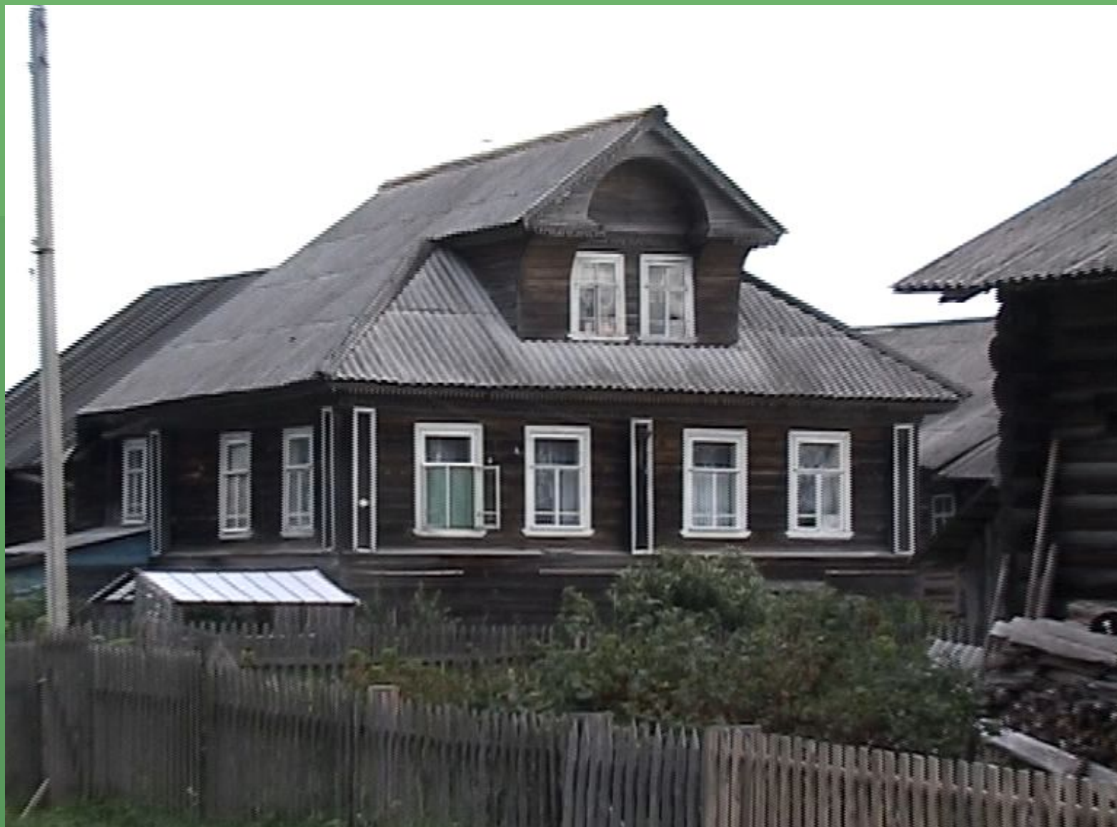
д. Нижняя. Дом с мансардой.