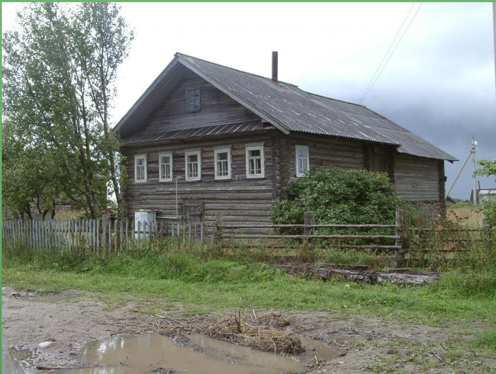
д. Борисово. Дом – четырехстенок на подклете.