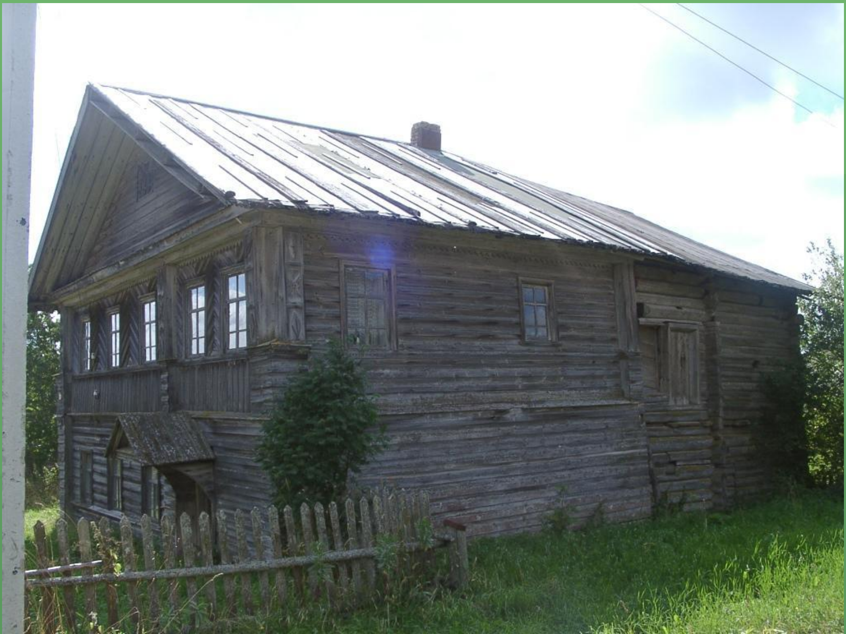
д. Песок. Дом - двор Катышевой Л.Ф.