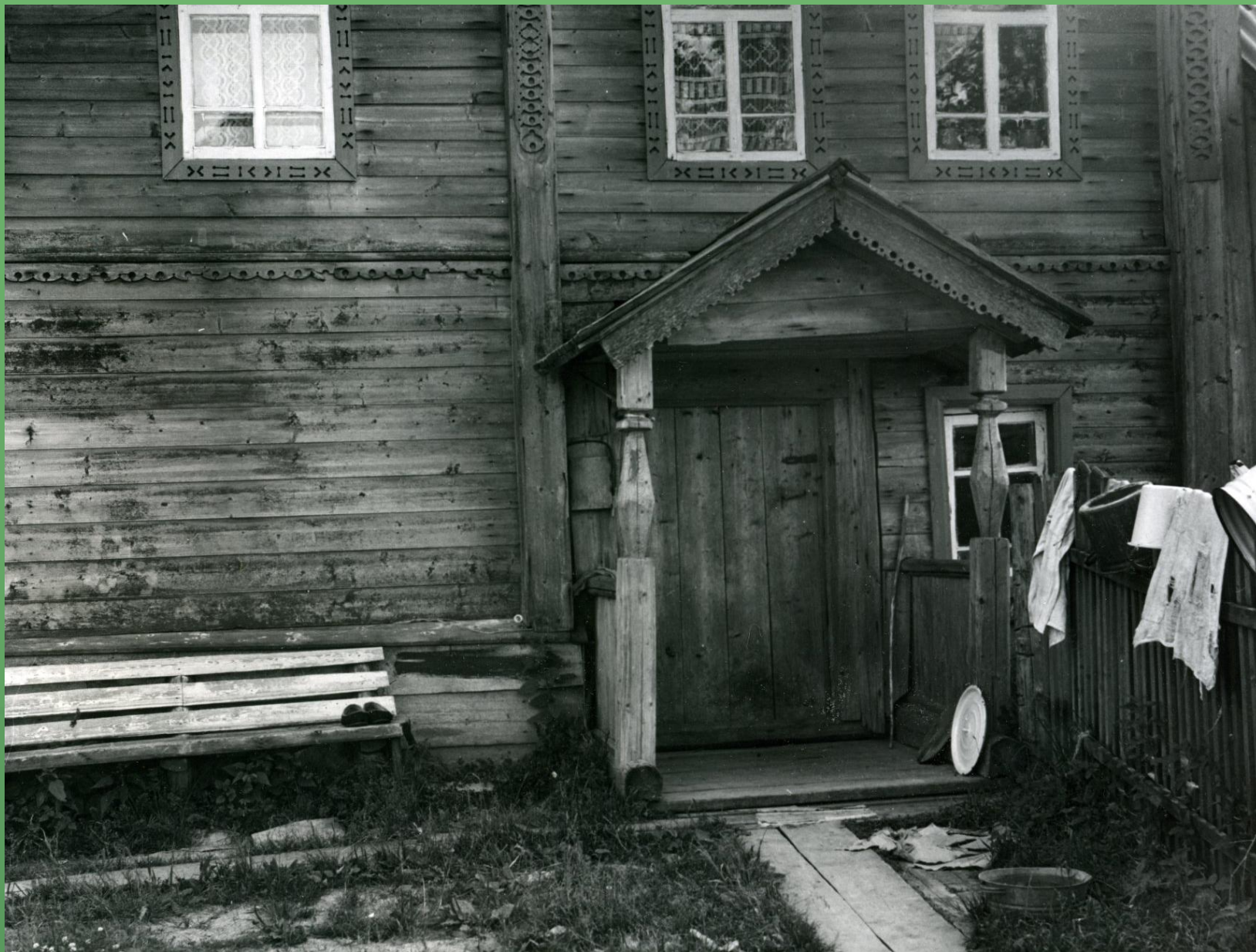
д. Олюшино, крыльцо. 1986 год.