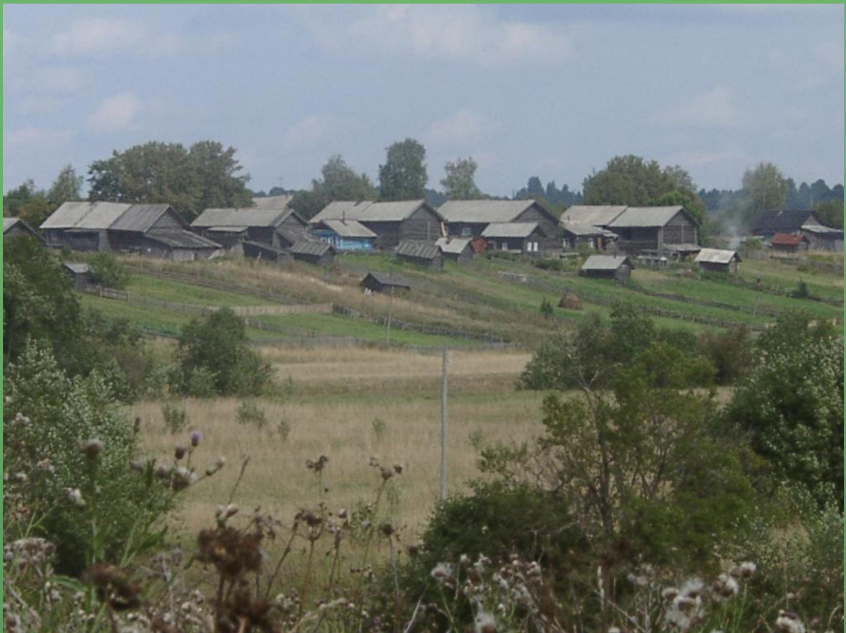
д. Савинская. Деревня – улица.