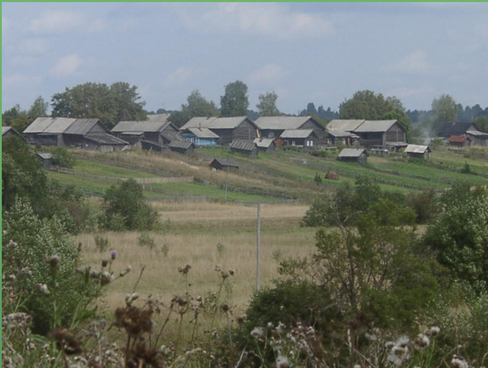
д. Савинская. Деревня – улица.