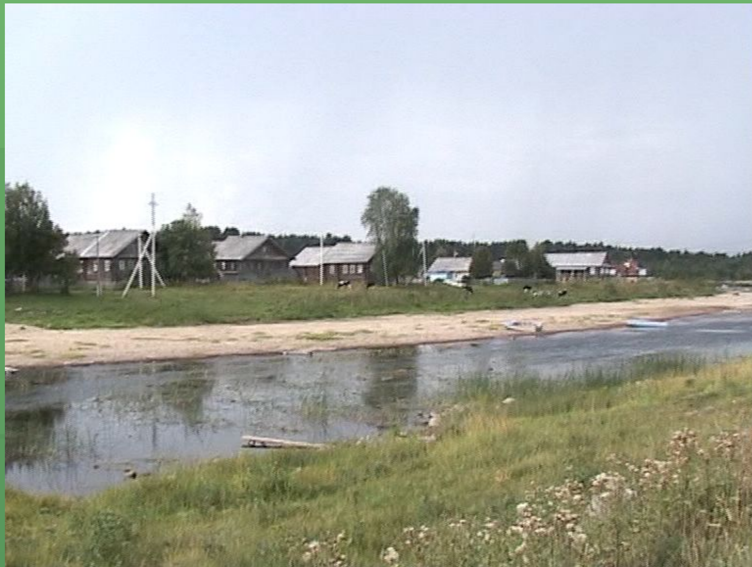
д. Боярская. Прибрежно - рядовая застройка деревни.