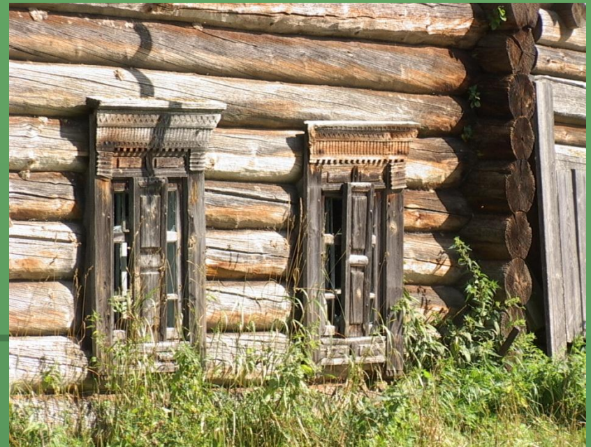
д. Нижняя и д. Заберезник, наличники.