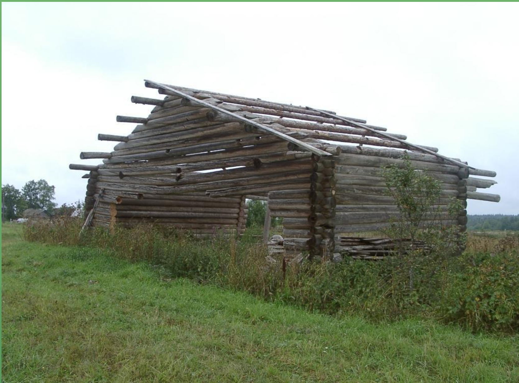
д. Бухара, овин у деревни.