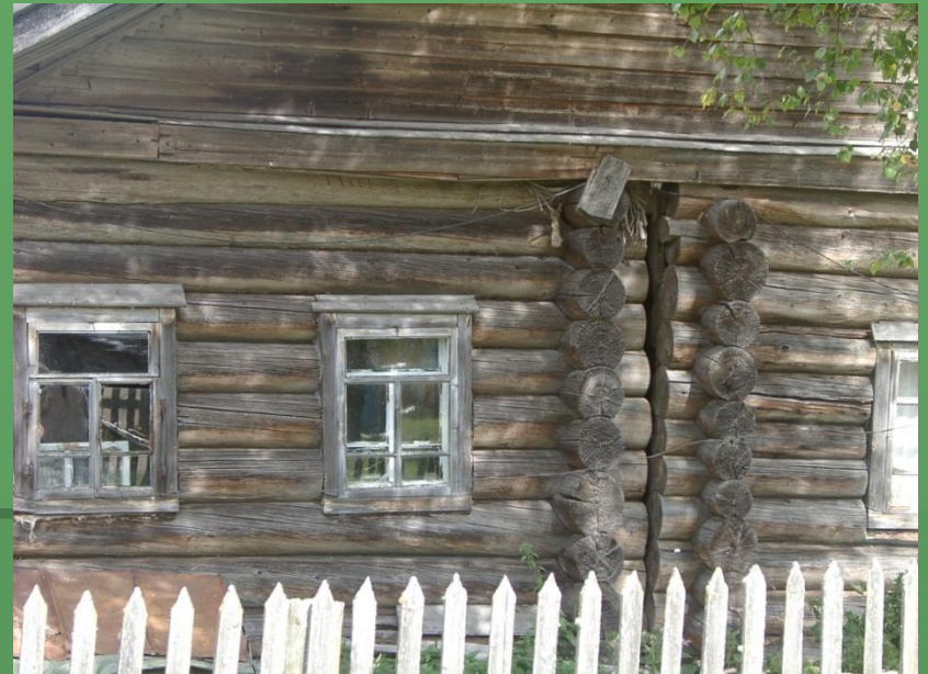
д. Нижняя. Изба – двойня.