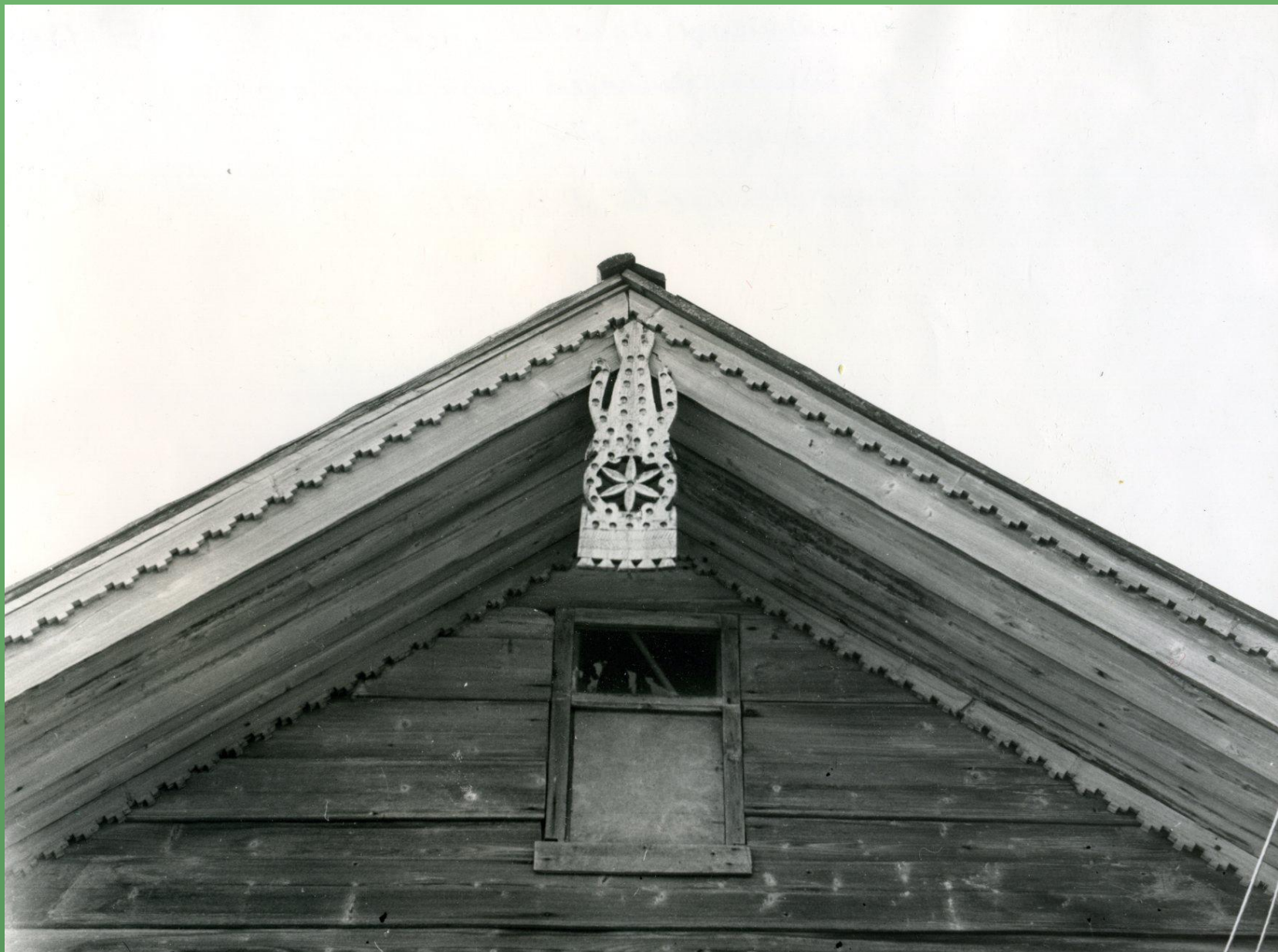
д. Емельяновская. Дом Умнова, «полотенце». 1986 год.