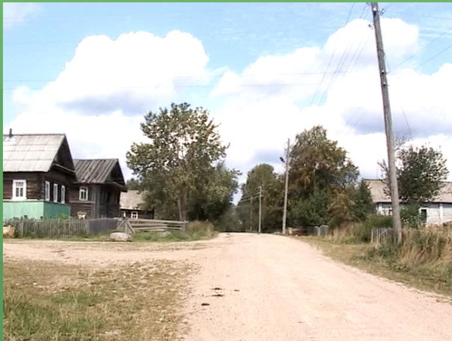
д. Коневка. Деревенская улица «встреча на встречу».