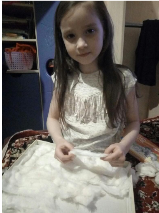
Приготовила место для стойбища