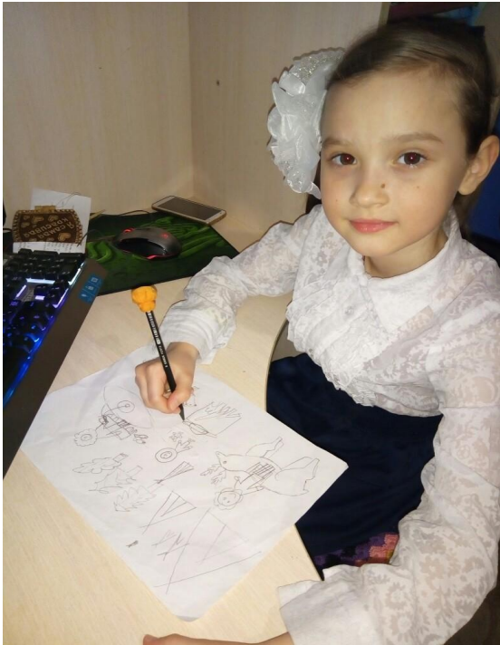
Нарисовала эскиз поделки