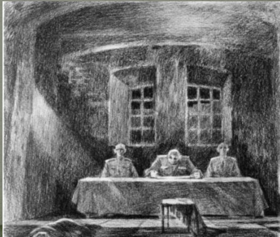
«Тройка» выносит приговор