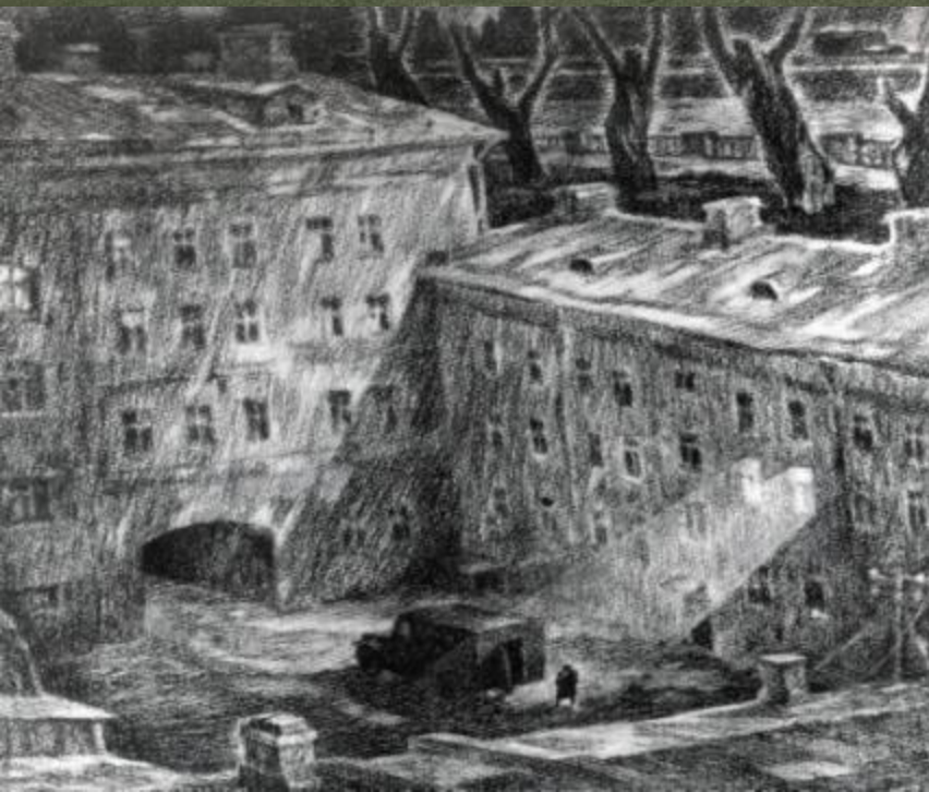
«Черный Ворон» увозивший арестованных