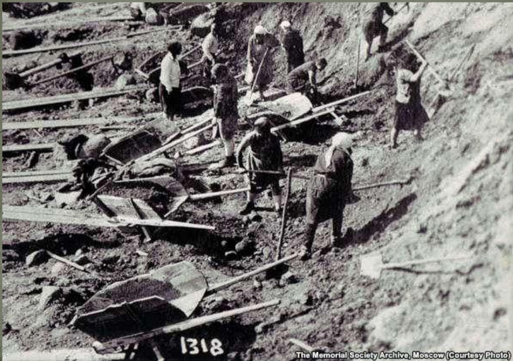
The Memorial Society Archive, Moscow (Courtesy Photo)