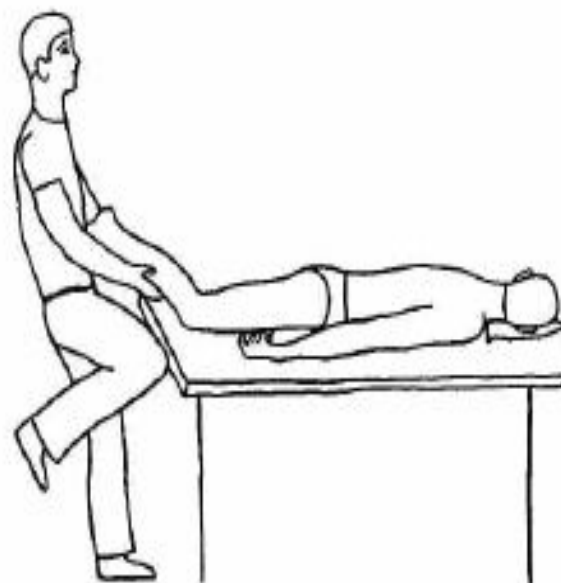
Рис. 11.5. Ручная тракция поясничного отдела позвоночника в положении больного на животе