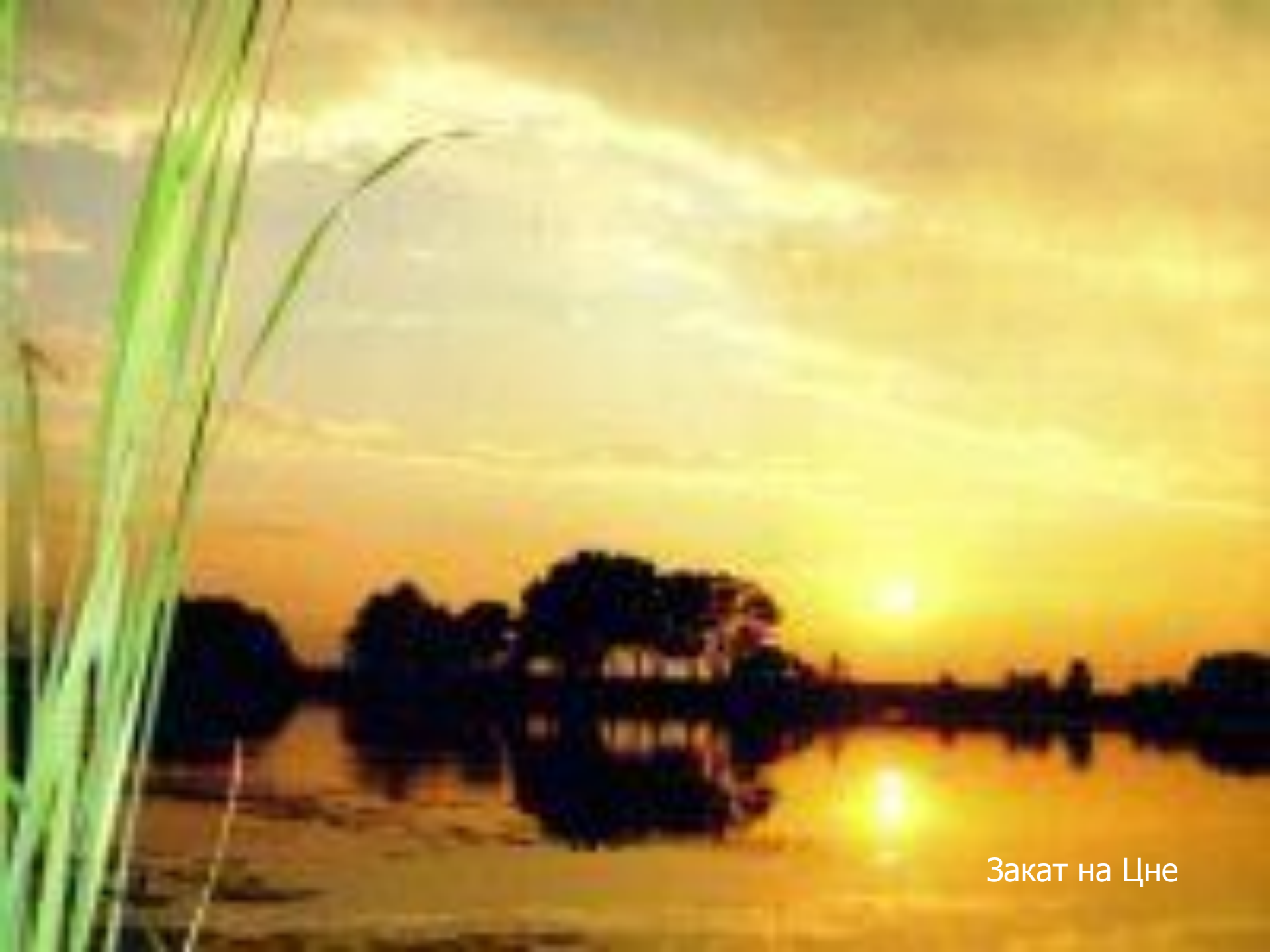
Закат на Цне