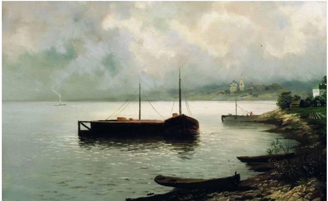
Исаак Левитан. «Волга» «Рыбаки на Волге»

(середина 1850-х годов) - по поручению Российского морского ведомства - с целью изучения хозяйственной жизни, промыслов, быта поволжского населения и последующего написания статей для «Морского сборника».