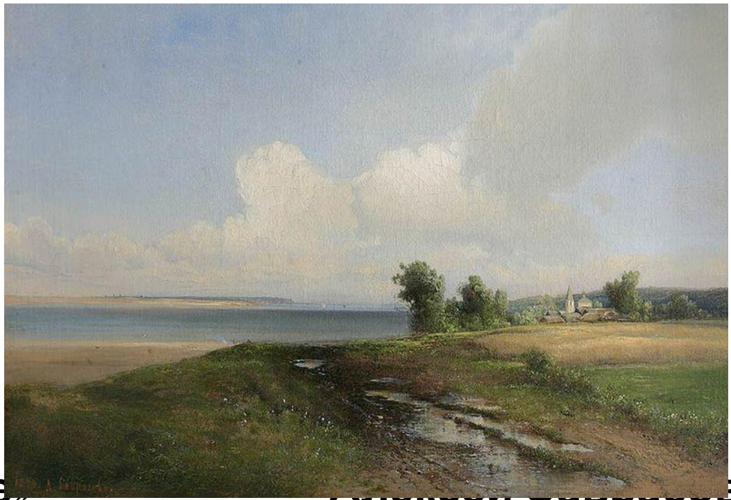
«Пейзаж. Берег Волги»