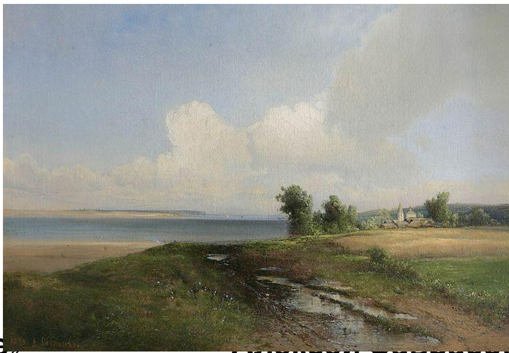
«Пейзаж. Берег Волги»