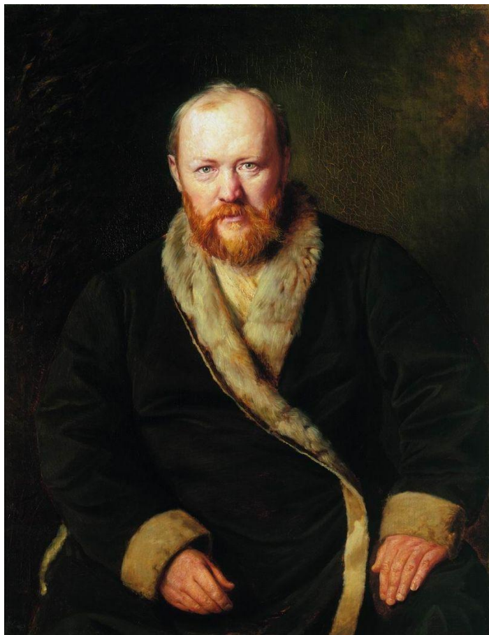
Портрет А.Н. Островского работы Василия Перова «Гроза», 1860 г.

Александра Николаевича Островского (1823-1886), творчество которого стало важнейшим этапом развития русского национального театра.