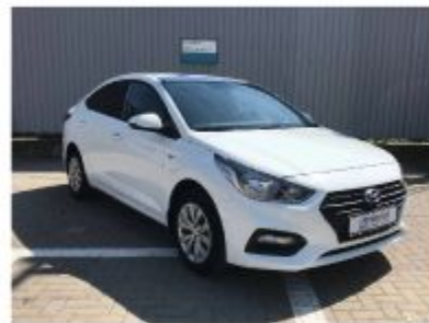
Hyundai Solaris, 2018