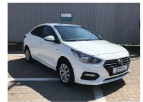
Hyundai Solaris, 2018