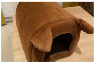
Домик для кошки