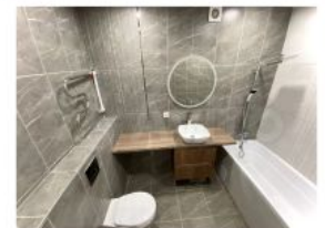
2-к. квартира, 47 м 2 , 16/24 эт.