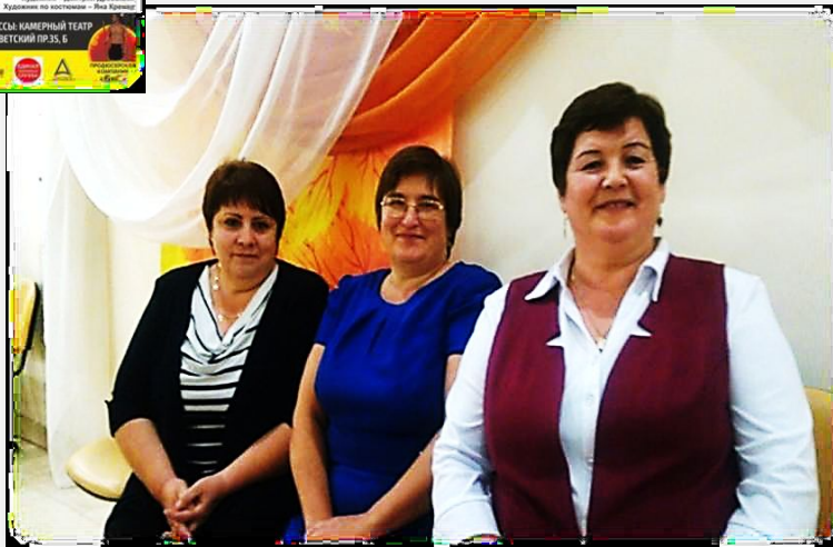
ДКС - спектакль «Что же хотят мужчины?»