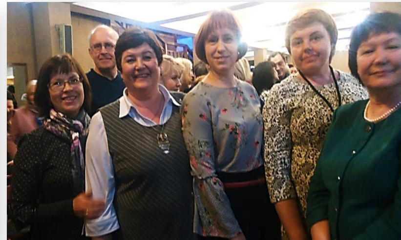
ДКМ – спектакль «Мой бедный Марат»