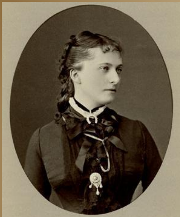
Княжна Екатерина Михайловна Долгорукова, получившая титул светлейшей княгини Юрьевской.

Марией Александровной , в девичестве была принцессой Максимилианой- Вильгельминой-Августой-Софьей- Марией Гессен-Дармштадтской, незаконнорожденной дочерью (от камергера) Вильгельмины Баденской