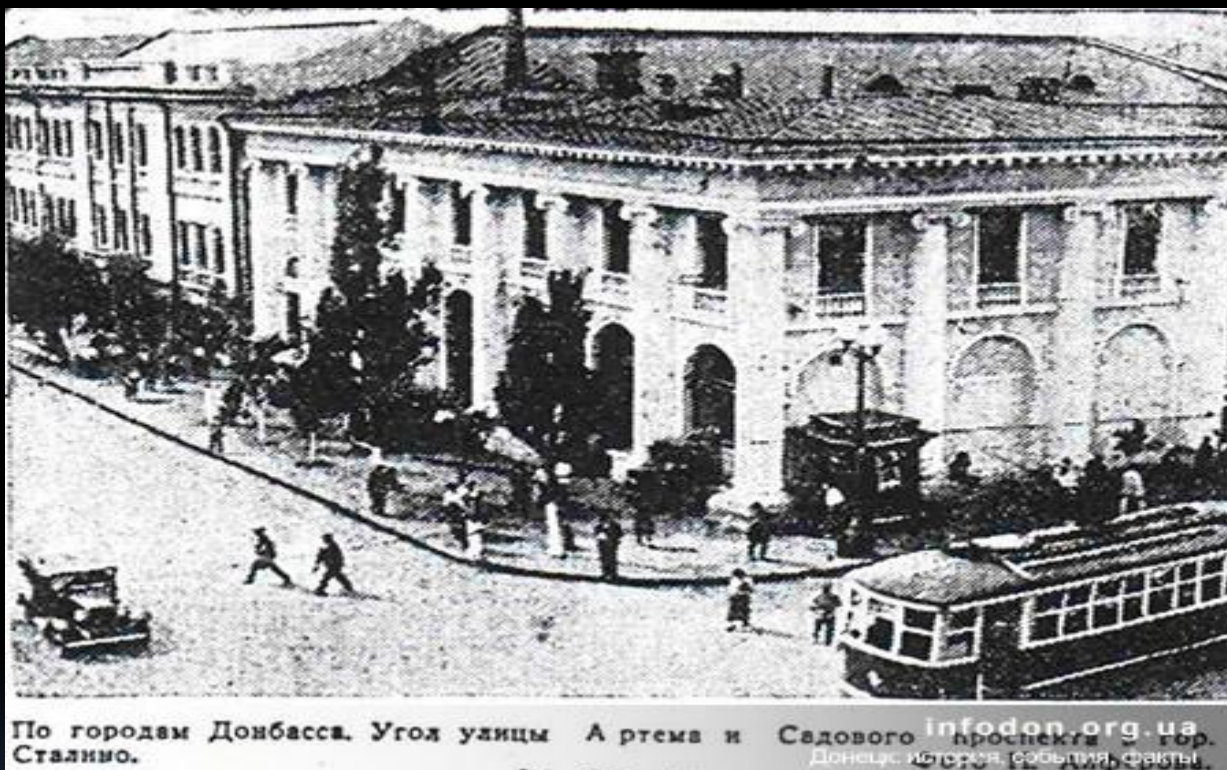
По городам Донбасса. Угол улицы Артёма и Садового проспекта в г. Донецке.

В 1928 году здесь появился первый трамвай. В это время здесь проживало более 64 тысячи человек.