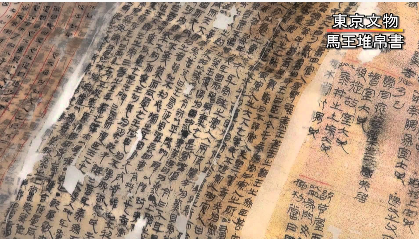
東京文物 馬王堆帛書