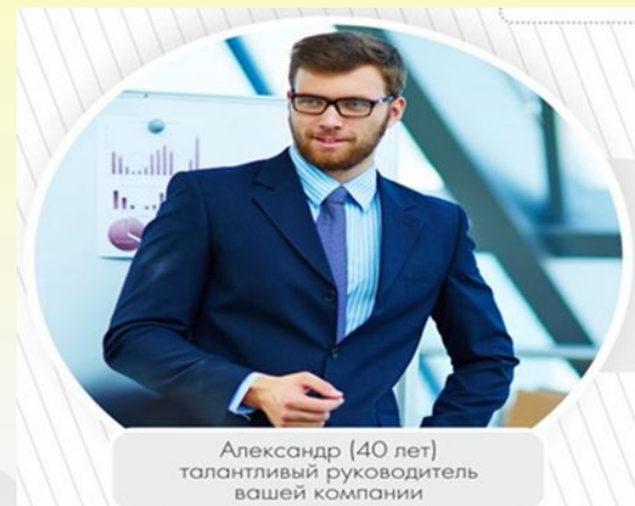
Александр (40 лет) талантливый руководитель вашей компании

*По курсу НБ РБ на дату расчета *При единовременной выплате сумма составит 19 738,16 USD