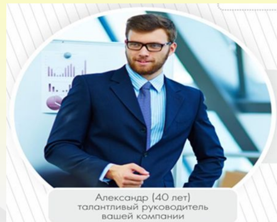
Александр (40 лет) талантливый руководитель вашей компании

*По курсу НБ РБ на дату расчета *При единовременной выплате сумма составит 19 738,16 USD