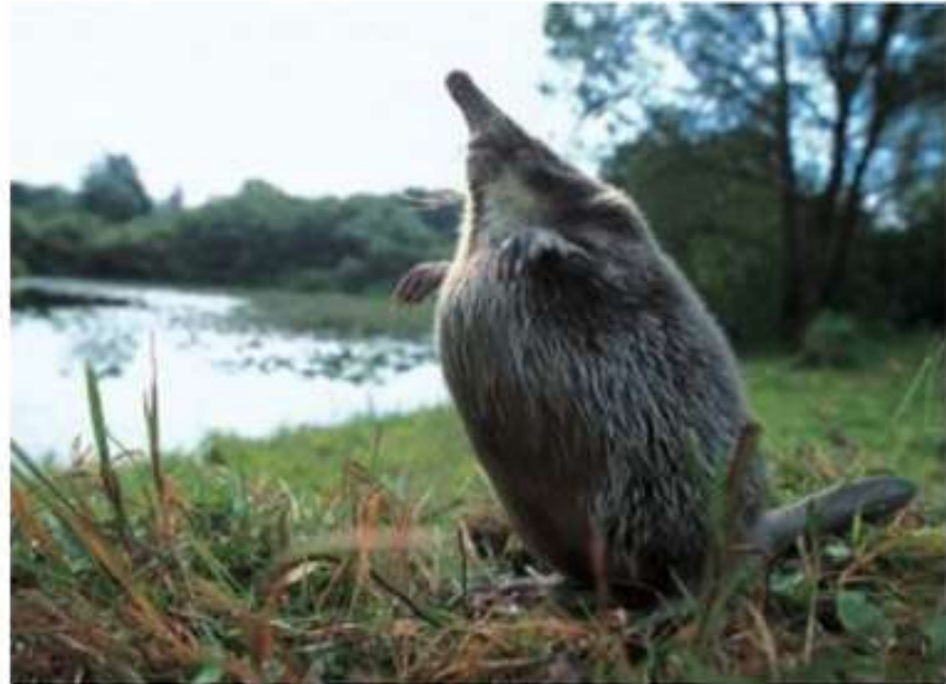
Выхухоль русская Эндемик, реликт Красная книга России