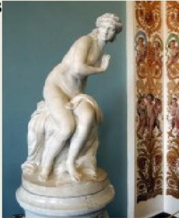
Ф. Ф. Щедрин. «Диана» (1795). Государственный Русский музей (Петербург)