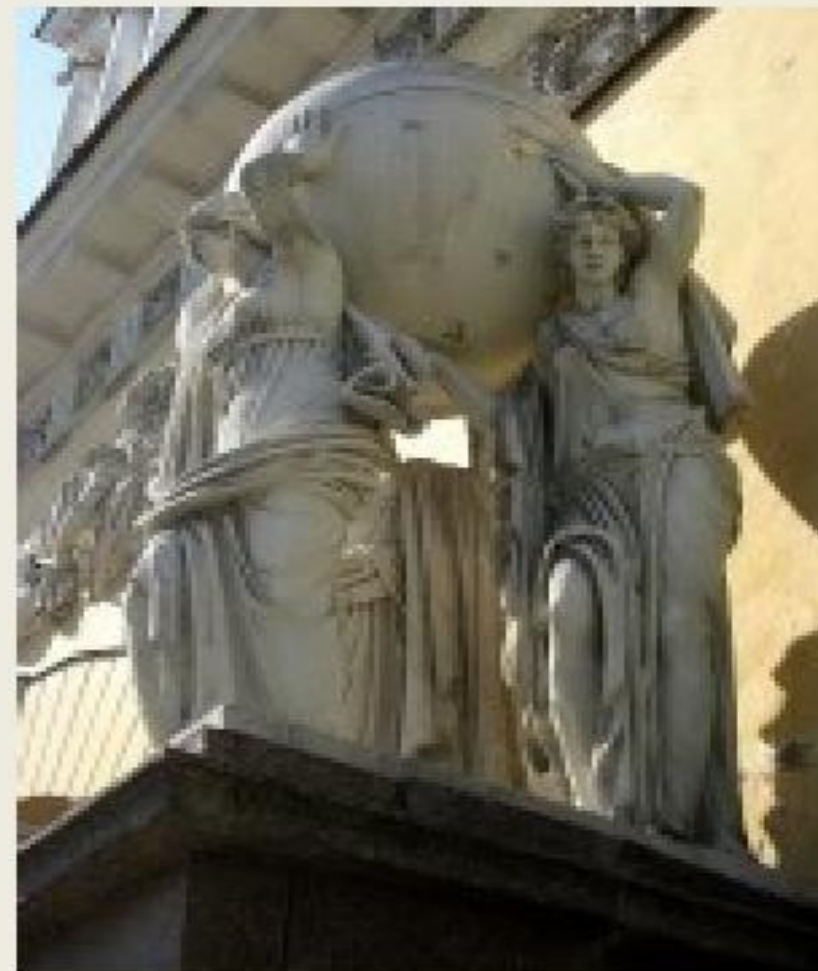
Ф.Ф. Щедрин. Кариатиды в Адмиралтействе (1812-1813)