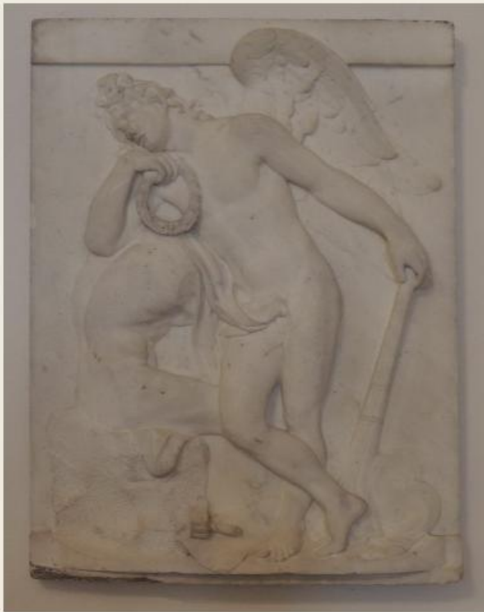
Рельеф с надгробия М. Козловского