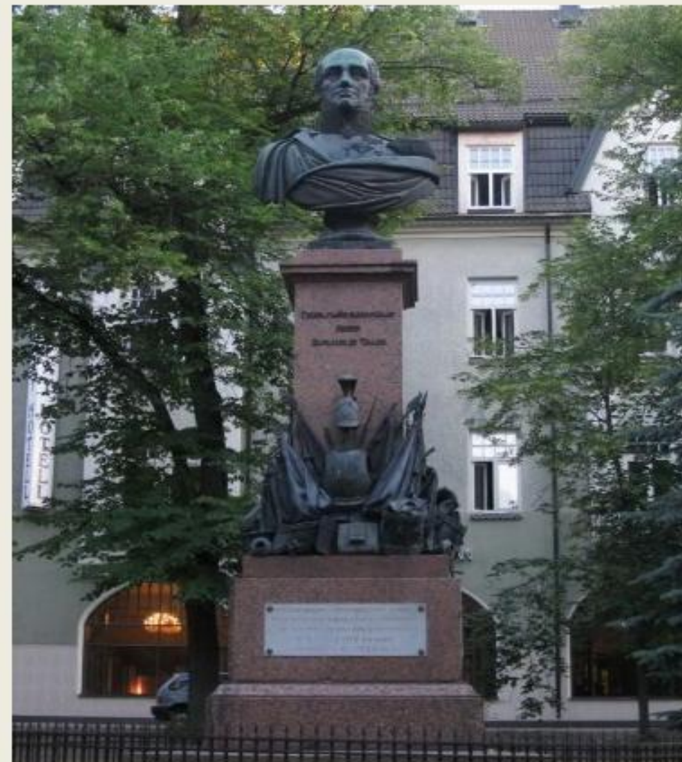
В. Демут-Малиновский. Памятник Барклаю-де-Толли (Тарту, 1849)