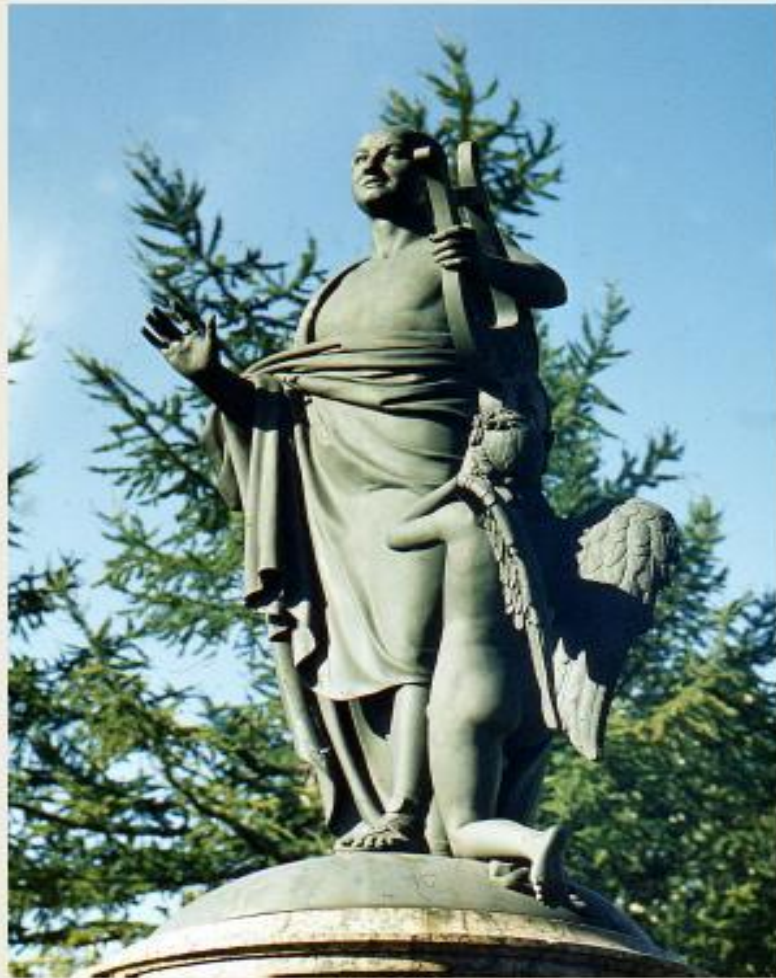
Пам'ятник Ломоносову в Архангельське