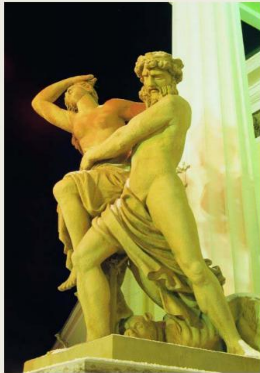
В. Демут-Малиновский «Похищение Прозерпины»