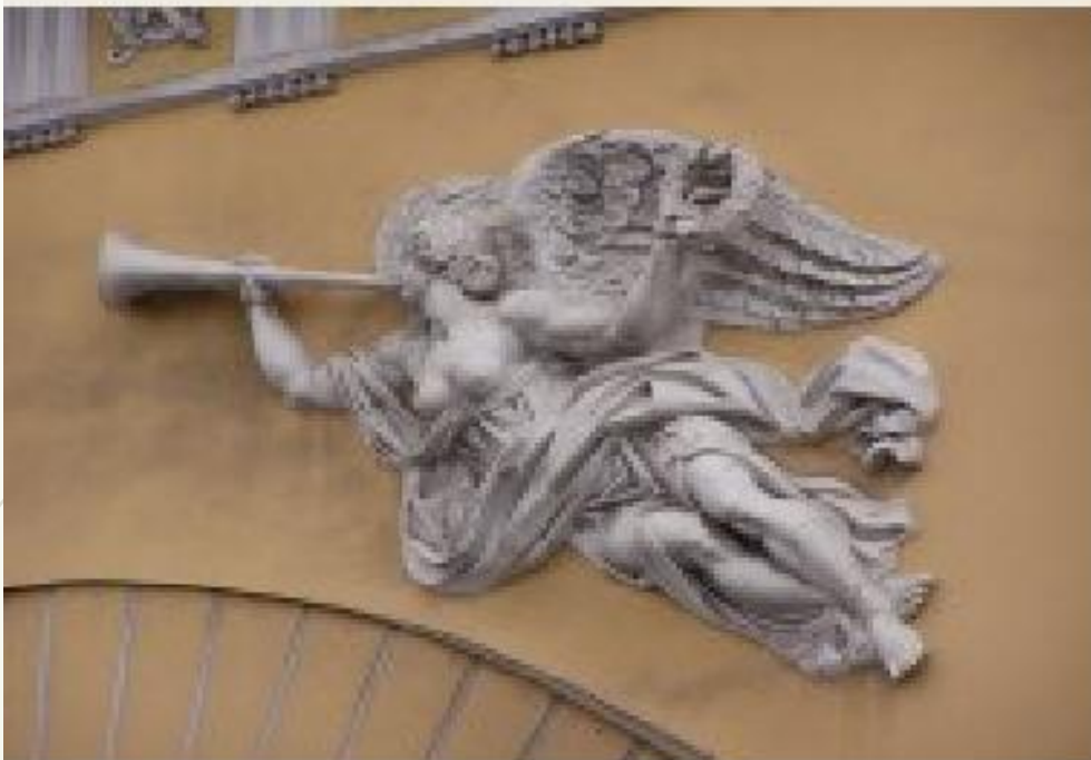
И.И. Терещенёв. Гений Славы, трубящий победу на арке Адмиралтейства