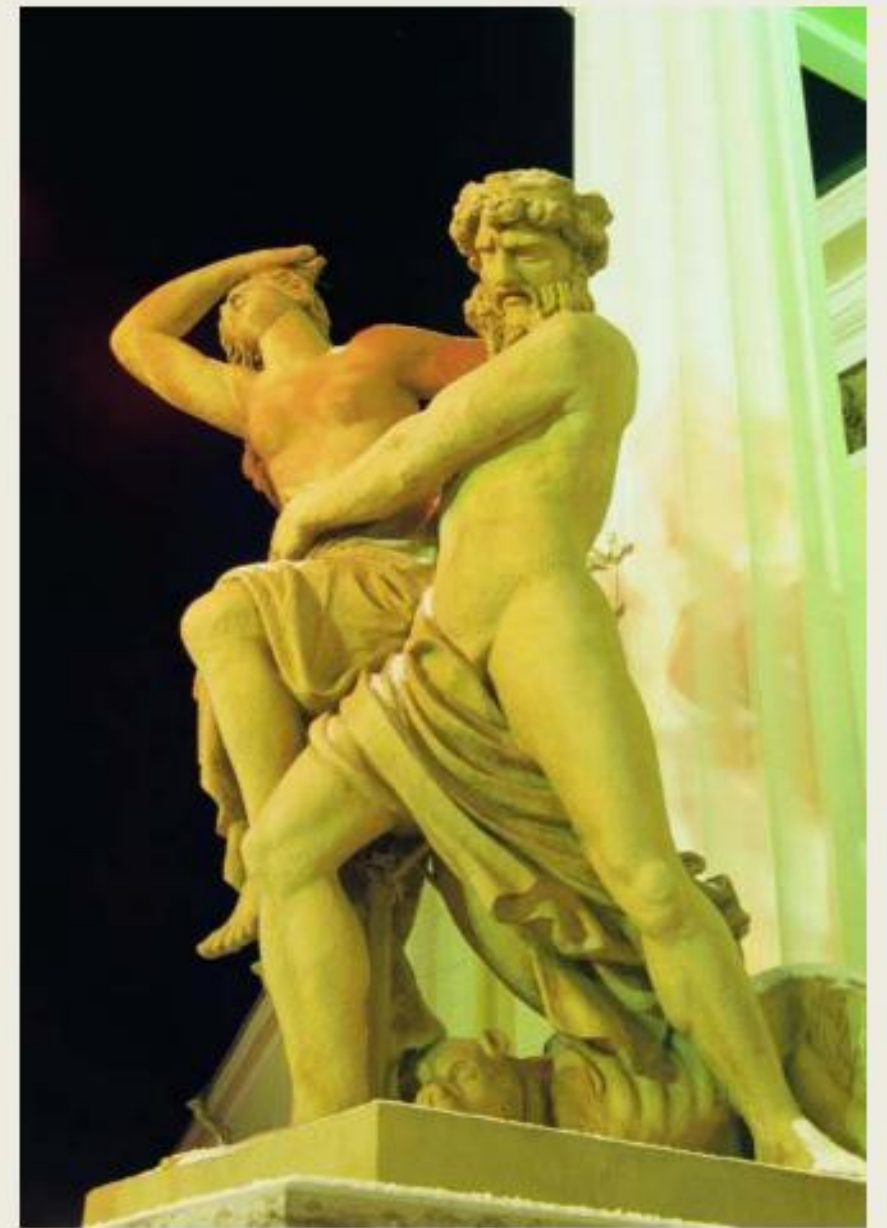
В. Демут-Малиновский «Похищение Прозерпины»