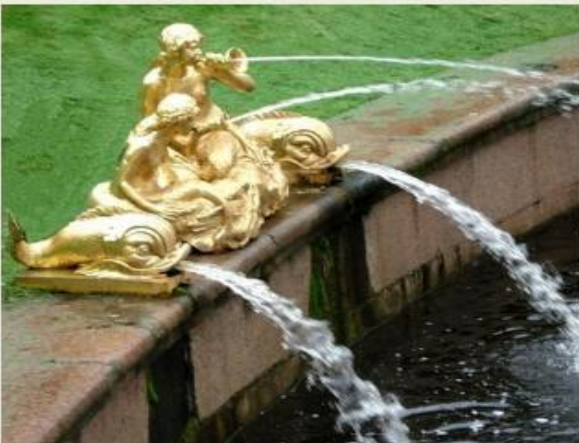
Ф.Ф. Щедрин. Фонтан «Сирены» в Большом каскаде Петергофа