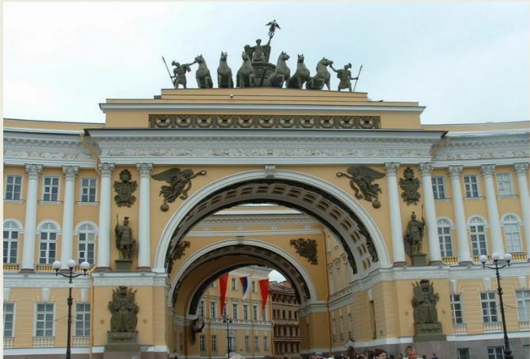
Арка Главного штаба