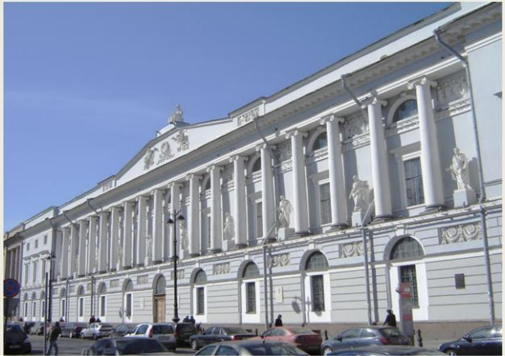
Здание Императорской публичной библиотеки