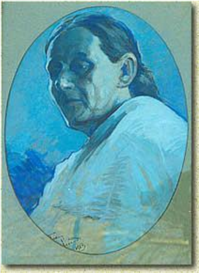
Портрет матери, выполненный Леонидом Андреевым в 1910 г.

Отец, Николай Иванович, землемер, рано умер, оставив жену с шестью детьми почти без средств к существованию.