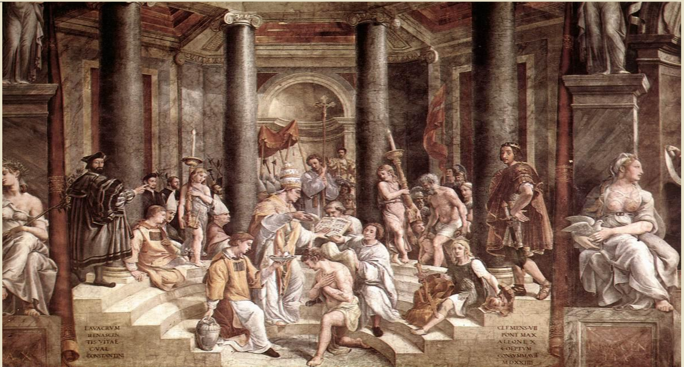
Крещение императора Константина.