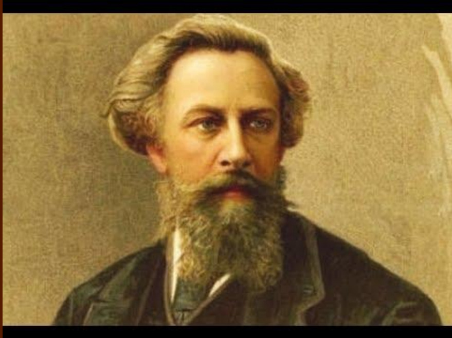
Алексей Константинович Толстой (1817- 1875)