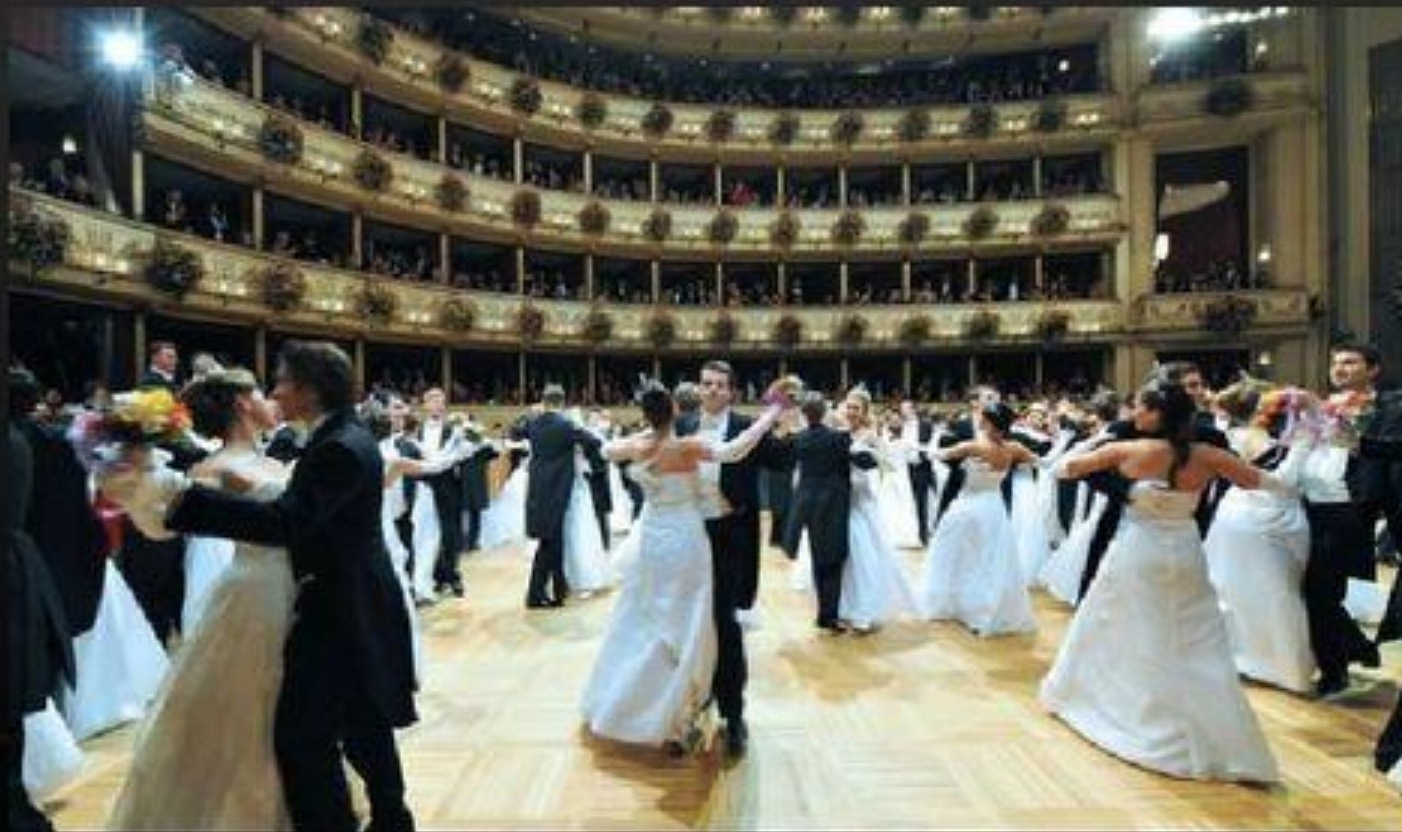
Венский бал – мероприятие со строгим дресс-кодом

Во Вторую мировую войну театр был частично разрушен, однако в 1955 году произошло его торжественное ре-открытие с оперой «Фиделио» Бетховена. По количеству представлений с Венской оперой не в состоянии сравниться ни один из других оперных театров. На протяжении 285 дней в году в этом здании на Рингштрассе ставится порядка 60 опер. Каждый год за неделю до первого дня Великого католического поста в здесь проходит Венский бал – мероприятие, занесенное в список нематериального культурного богатства, охраняемого ЮНЕСКО.