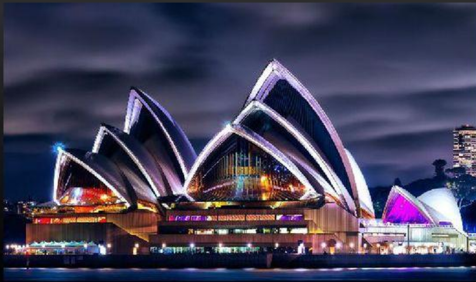
Сиднейский театр ночью

Общая площадь здания превышает два гектара. Внутри вы встретите без малого тысячу комнат, ведь здание является «штаб-квартирой» для Австралийской оперы, Сиднейского симфонического оркестра, Национального балета и Сиднейской театральной труппы.