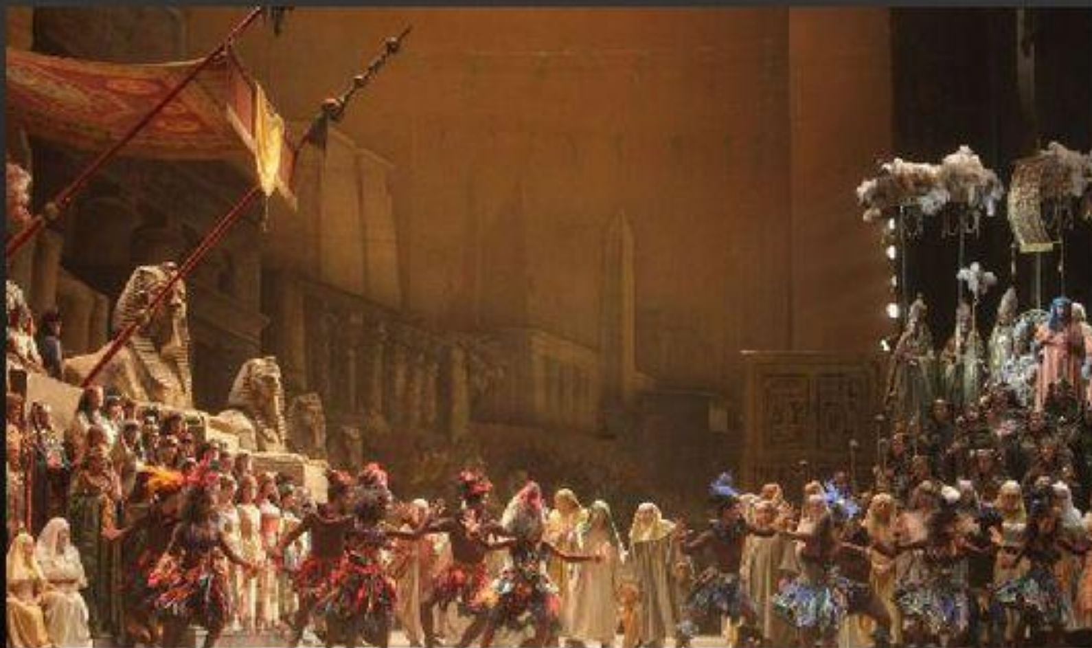
Фото сделано на опере «Аида» Джузеппе Верде

Сегодня Ла Скала по праву читается одним из самых известных театров мира. Это первое после Миланского собора, что осматривают прибывшие в Милан туристам.