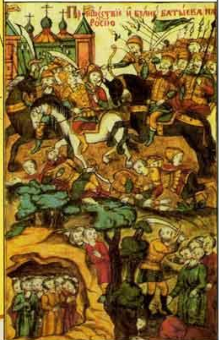
Нашествие хана Батю на Русь