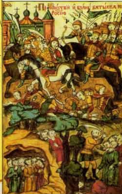
Нашествие хана Батю на Русь