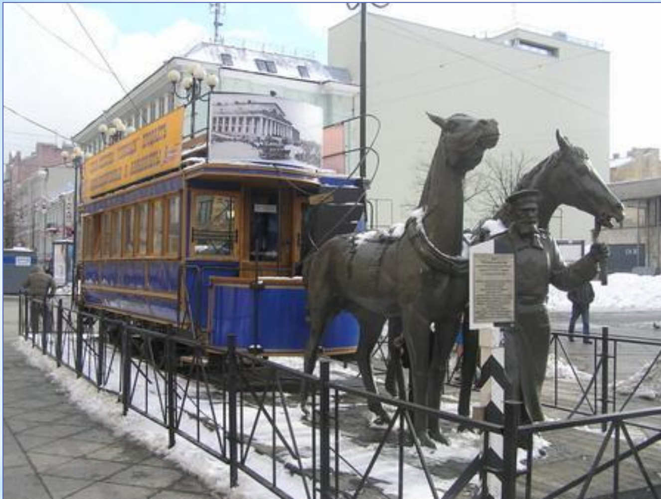
* Конка. Памятник на Васильевском острове.