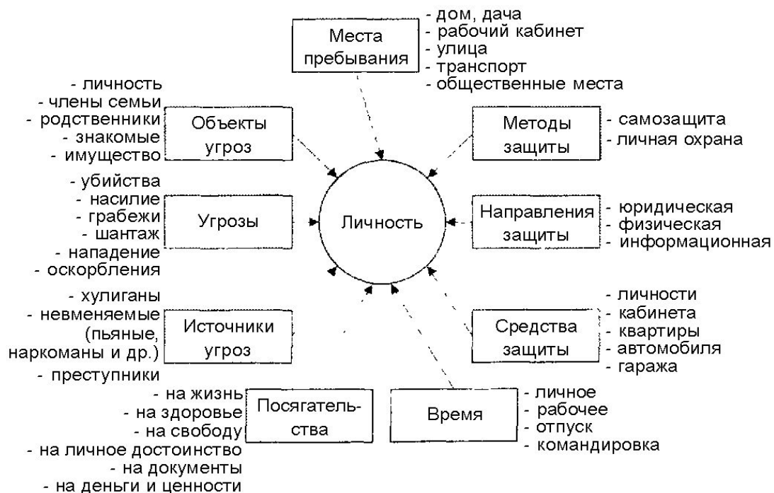
Рисунок 1 - Концептуальная модель безопасности личности

Анализ этих моделей дает представление о многообразии действий и мероприятий по обеспечению ИБ.