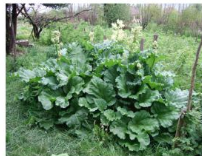
РЕВЕНЬ КОМПАКТНЫЙ Rheum compactum Статус: 3 (R) - редкий вид.