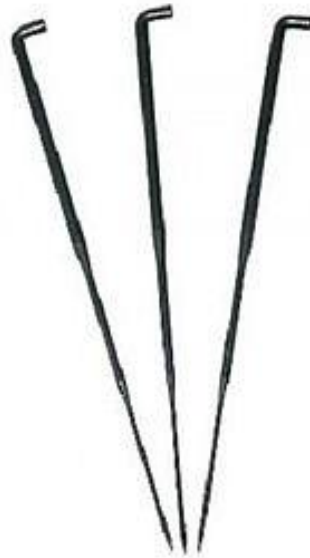
Звезда № 38

Немного шерсти разных цветов; игла для валяния; толстая губка; пальцы-рамка диаметром 10 см; фетр для основы; мулине разных цветов; бисер; кусок картона; ткань для оформления задней стороны; синтепон; иголка; ножницы.