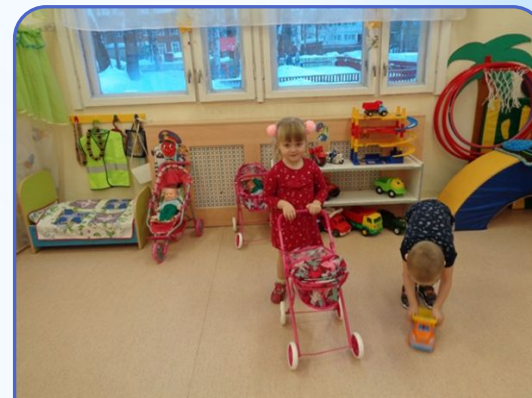
Центр познавательной и речевой активности