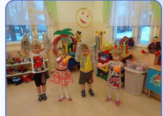
Центр физической активности