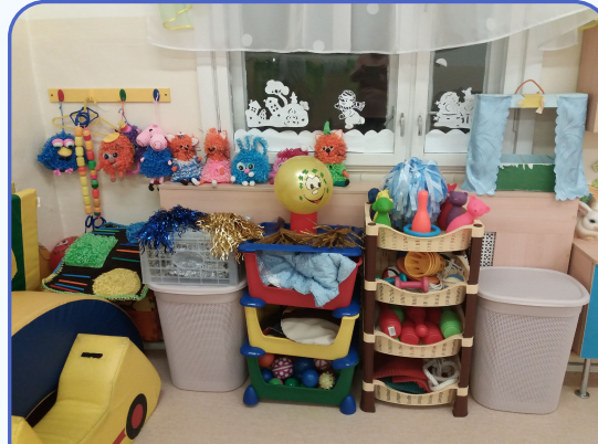
Центр физического и сенсорного развития