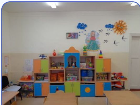
Центр познавательной и речевой активности