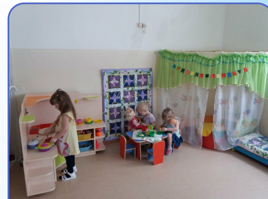
Центр познавательной и речевой активности