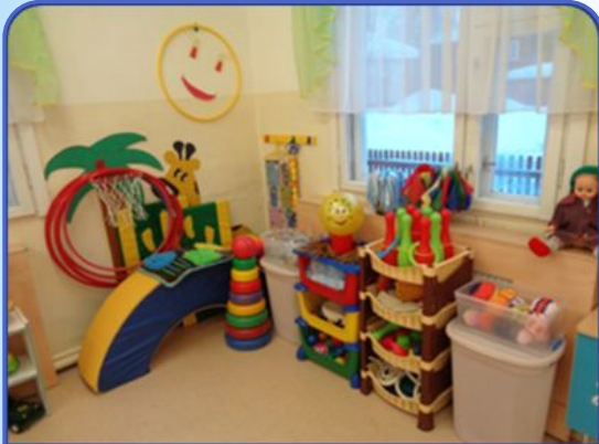
Центр физического и сенсорного развития

Ребятам раннего возраста надо очень много двигаться. Именно в движении и происходит их активное развитие