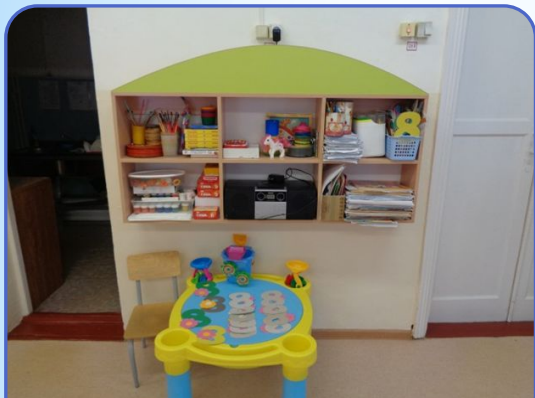
Центр художественно- эстетического развития

Именно в этих центрах и зарождаются первые интересы и способности детей раннего возраста - кто-то сразу выбирает пирамидку, кто-то пазлы - развитие аналитических способностей, а кто-то катает машинку.