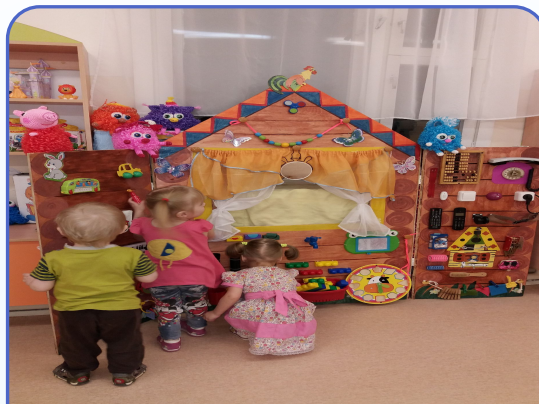
Центр познавательной и речевой активности