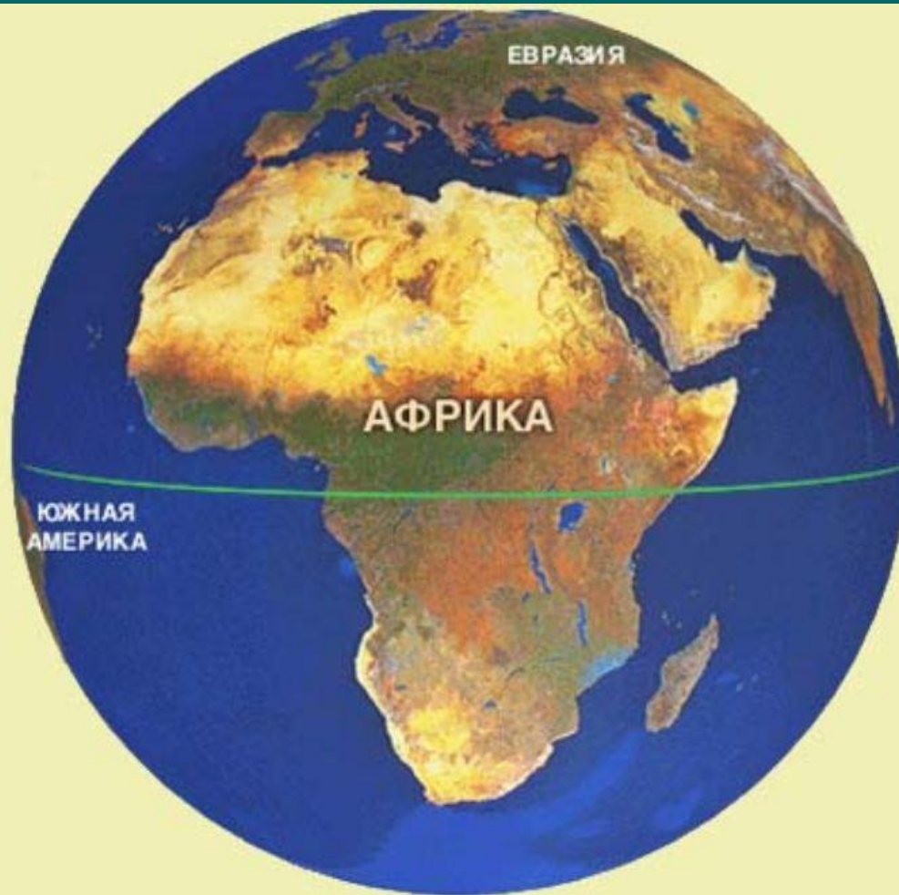
Африка на глобусе