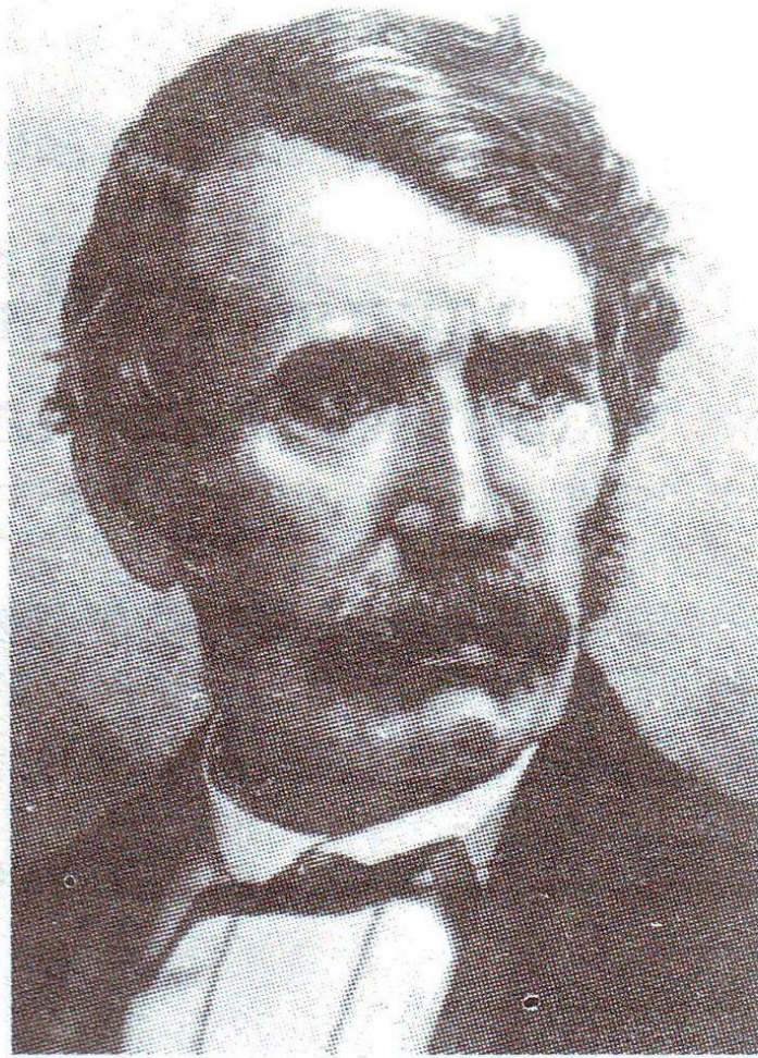
Давид Ливингстон (1813—1873)