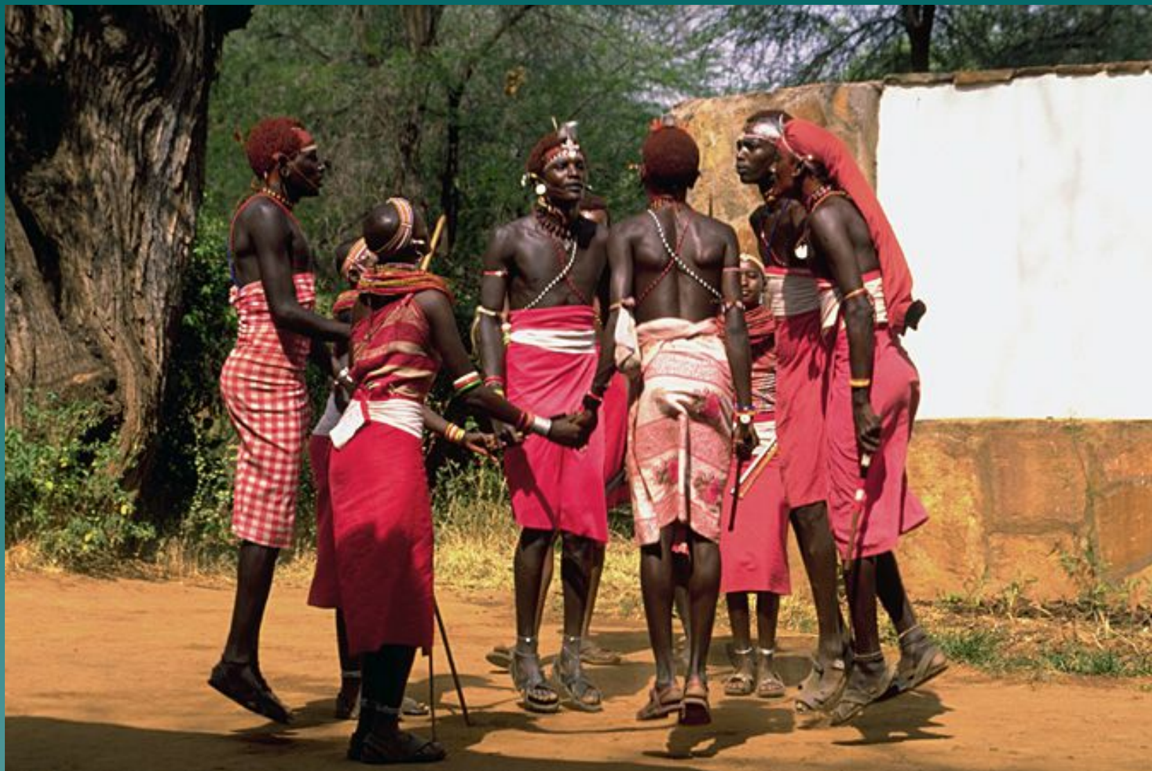
Карамаджонги - самые высокие люди, средний рост 180-190 см