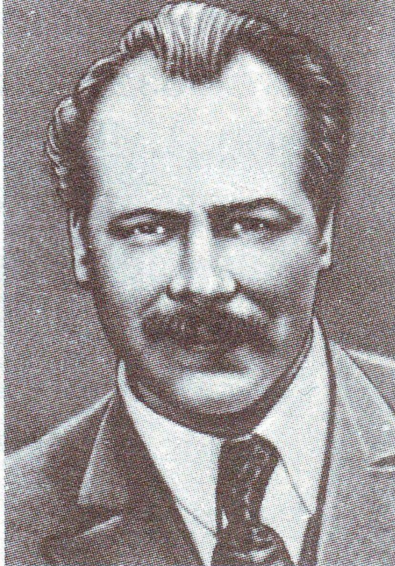
Н. И. Вавилов (1887—1943)