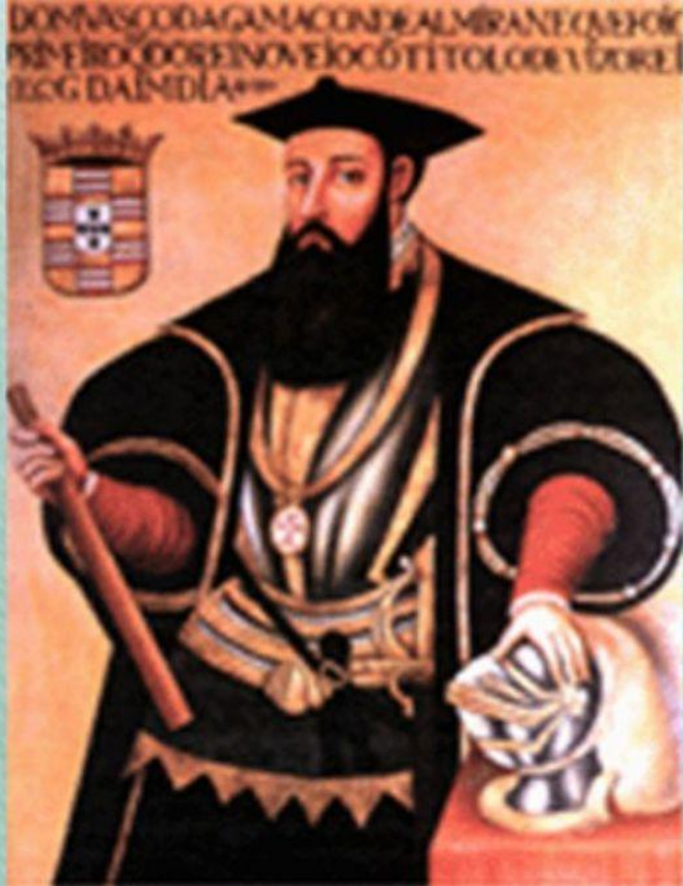
Васко де Гама