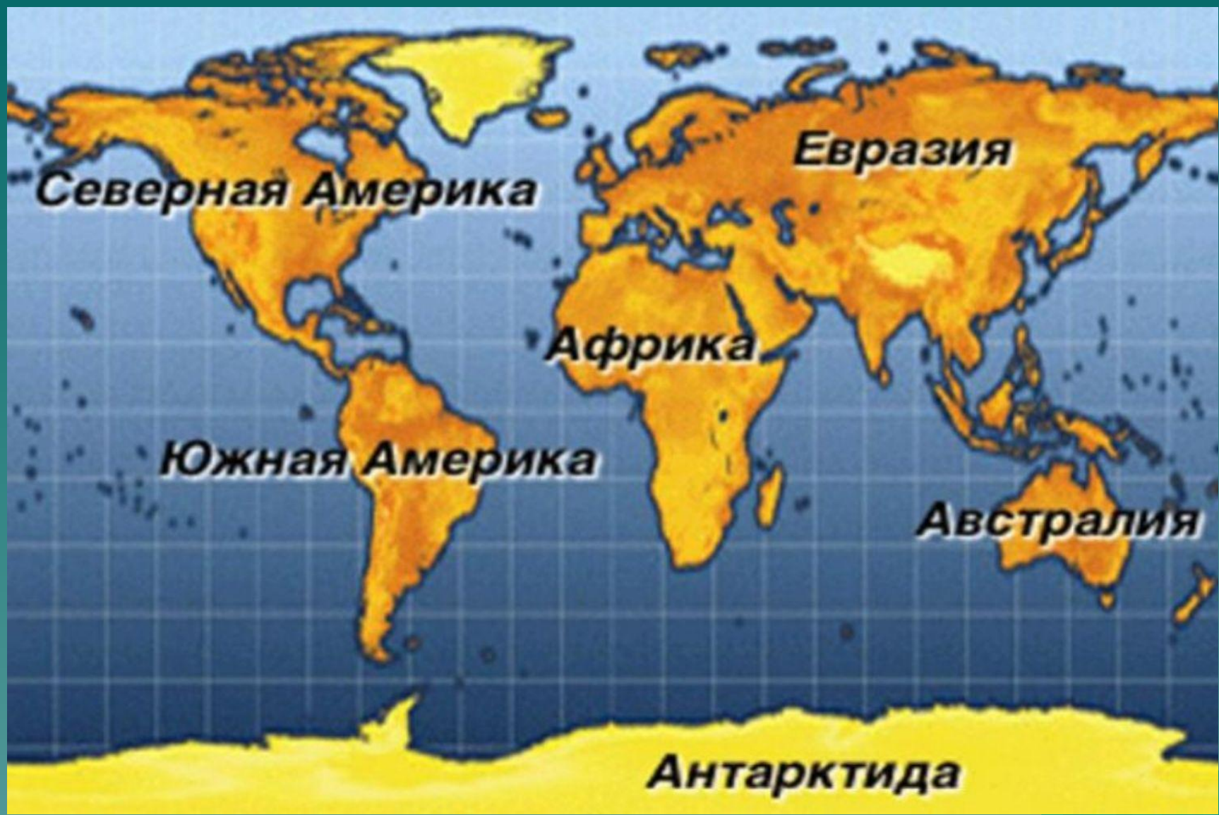
Африка на карте мира