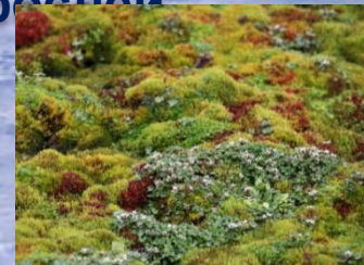
Мхи и лишайники