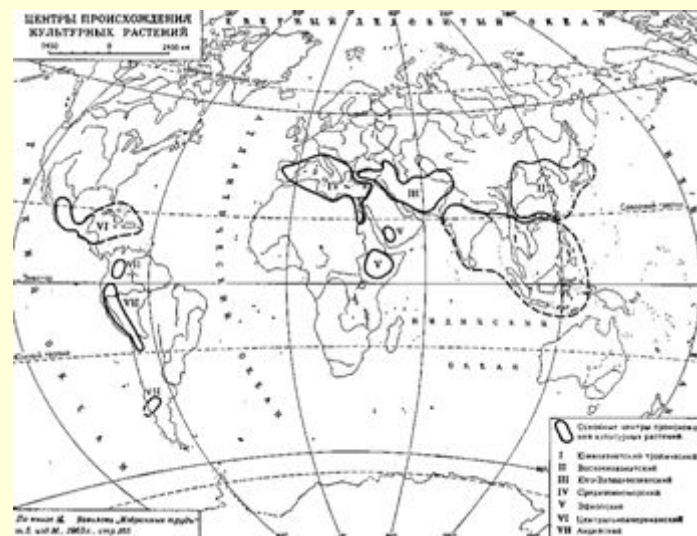
Вавилов Николай Николаевич