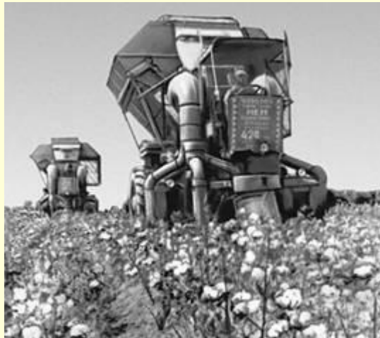
Уборка хлопчатника в Ферганской долине