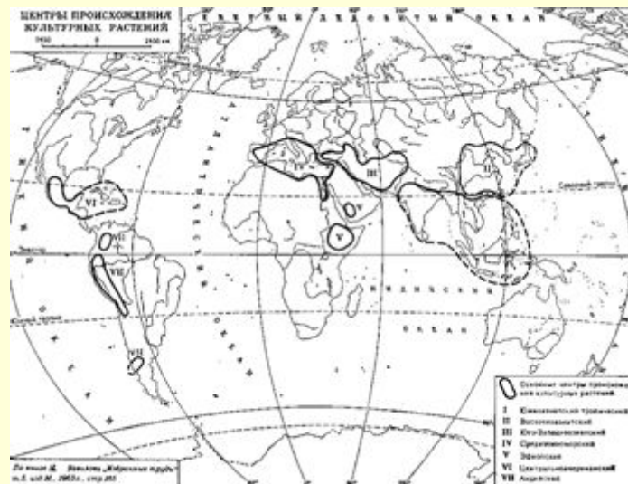
Вавилов Николай Николаевич