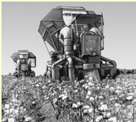
Уборка хлопчатника в Ферганской долине

Кукуруза, длинноволокнистый хлопчатник, какао, тыква, табак.