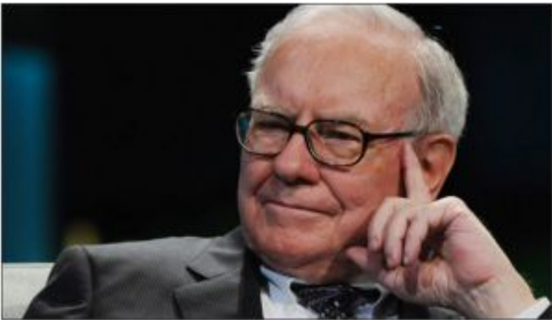
Уоррен Баффет, инвестор, миллиардер