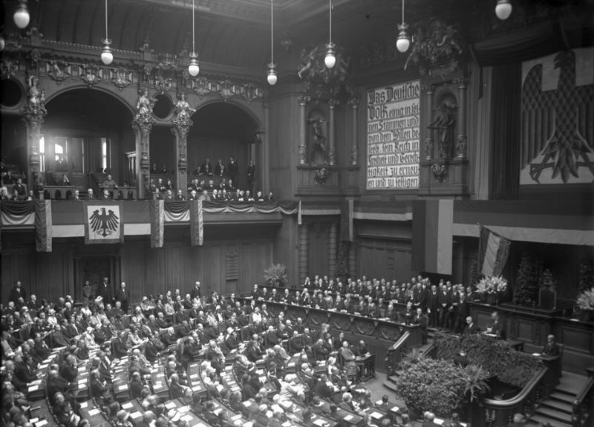
August 1930