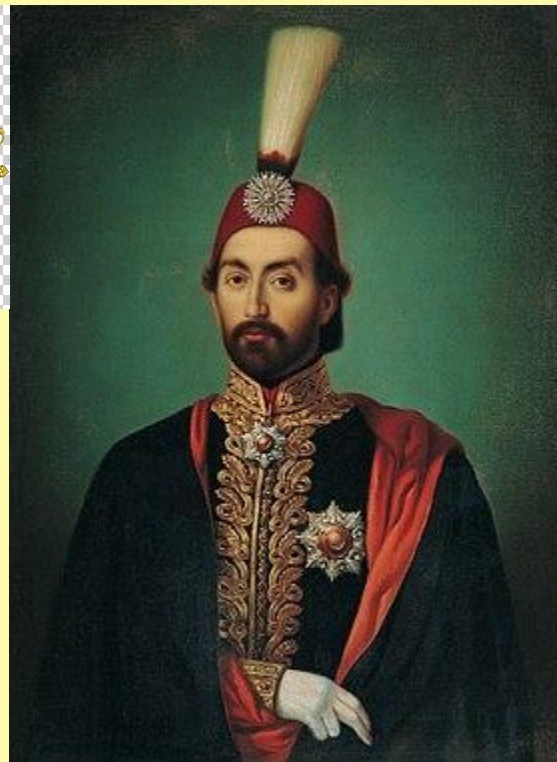
Султан Абдул-Меджид I (1839-1861 гг.)