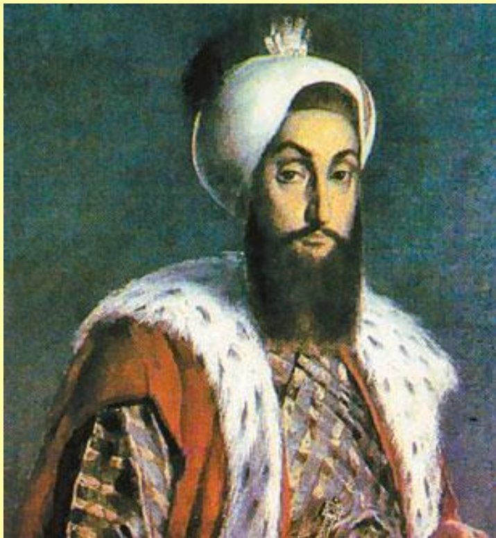
Султан Селим III (1789-1807)