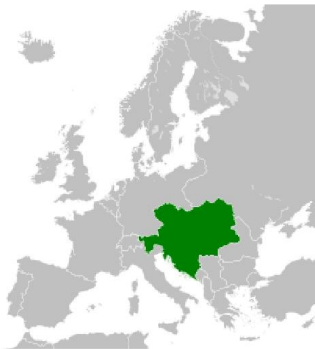
Австро-Венгрия на карте Европы.