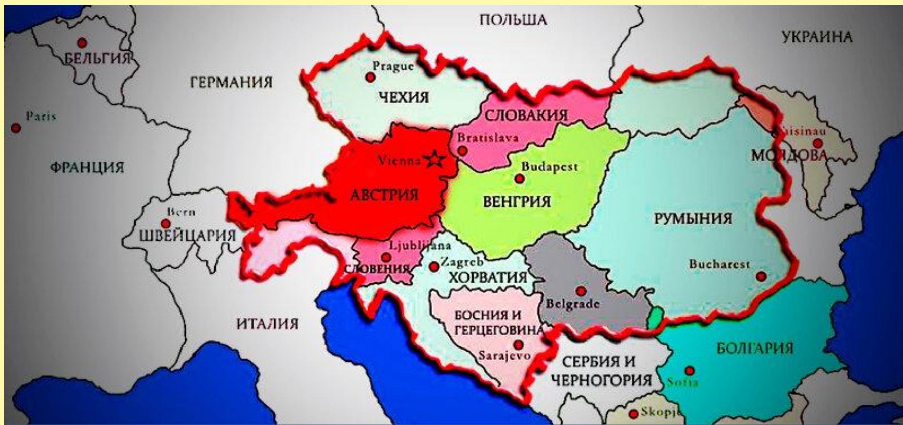
Границы Австрийской империи к 1914 г