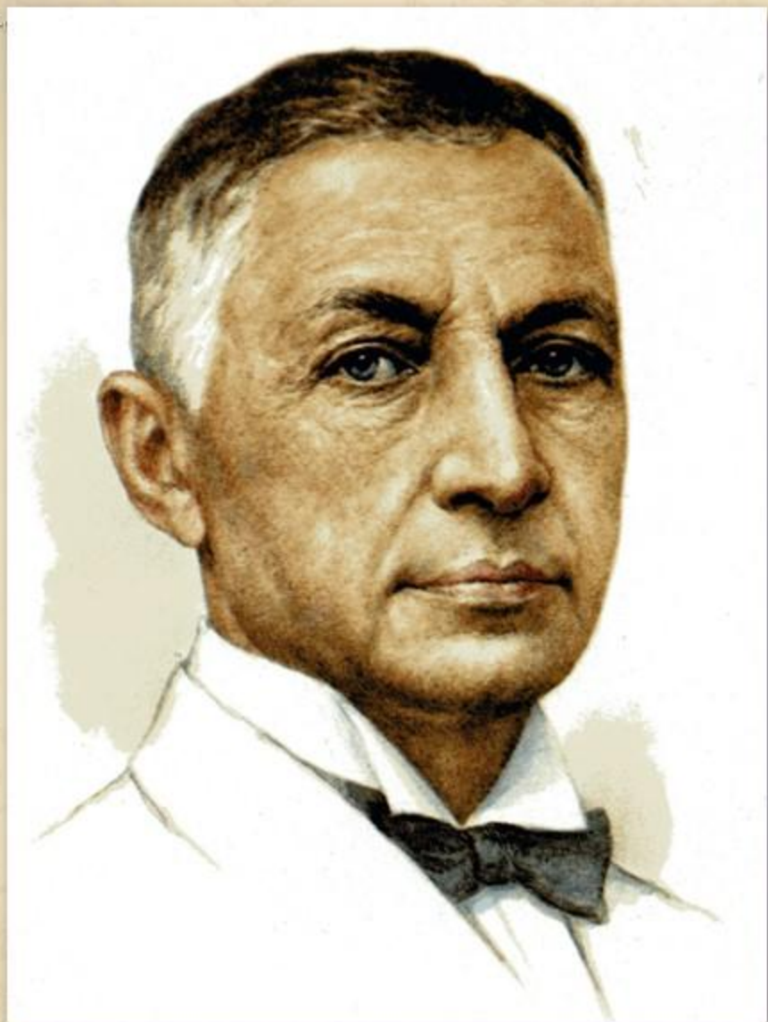
Иван Алексеевич Бунин