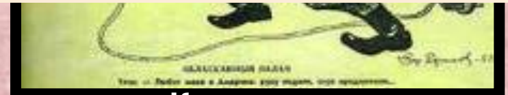
Карикатура на Иосипа Броз Тито