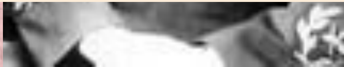
Иосип Броз Тито

1949 г. – разрыв отношений СССР с Югославией