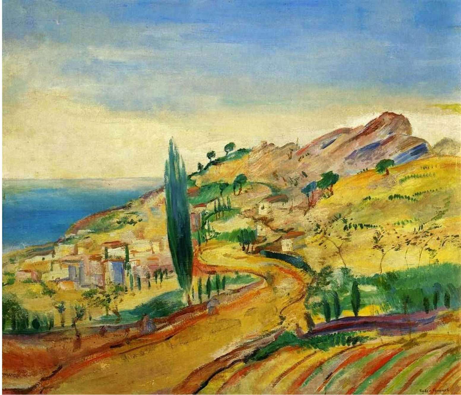
Дорога в Алушке