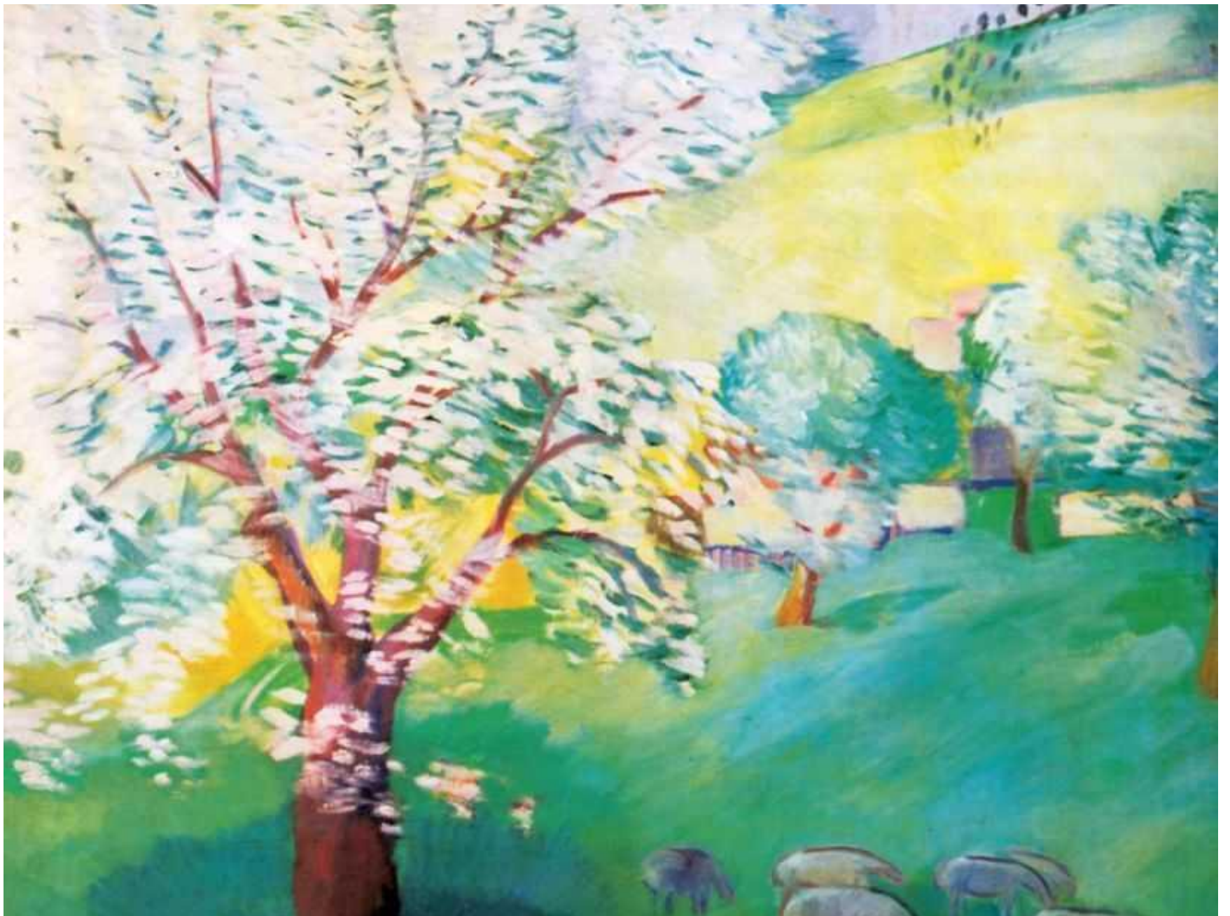
Весна в Крыму.