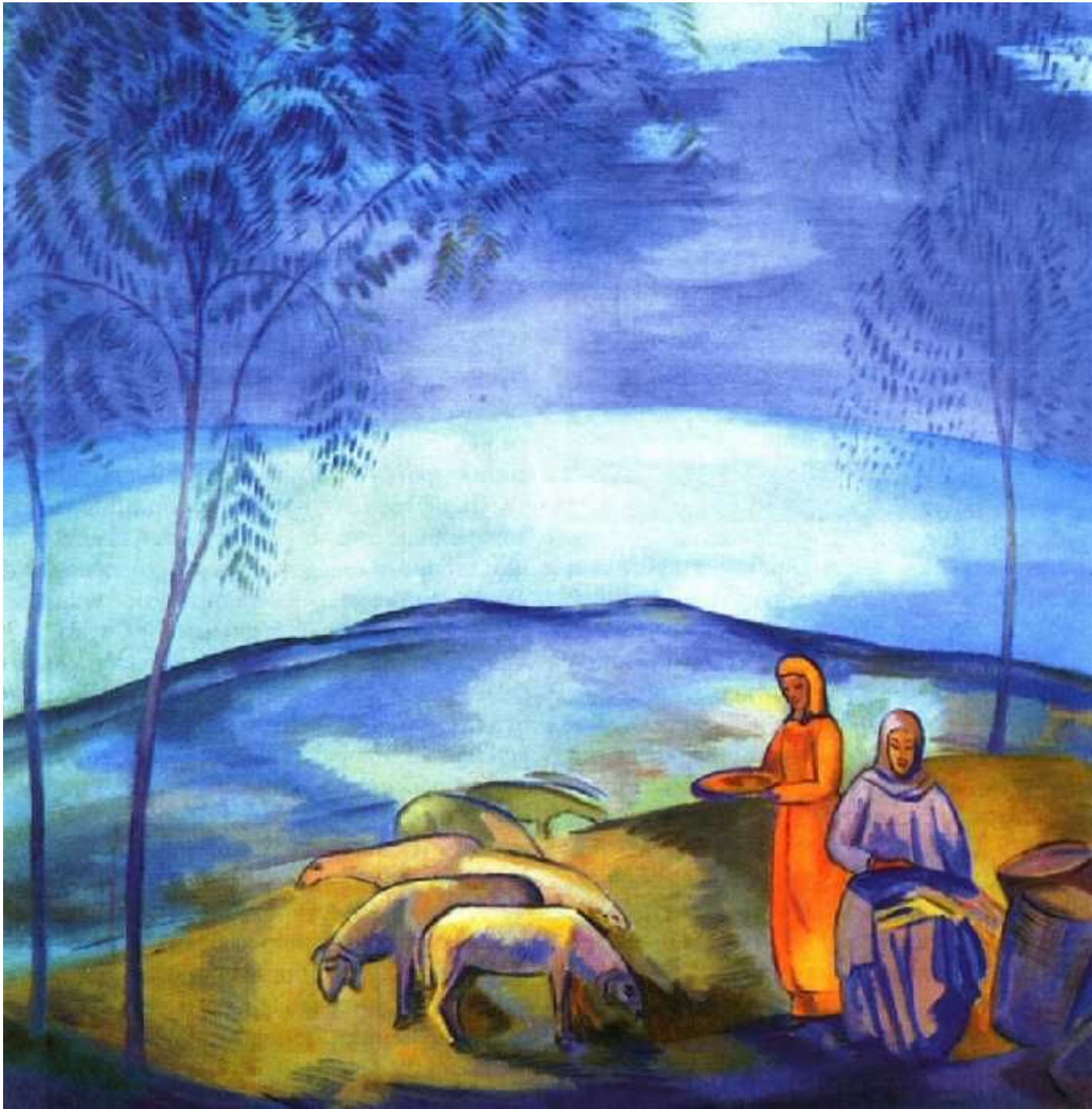
Вечер в степи