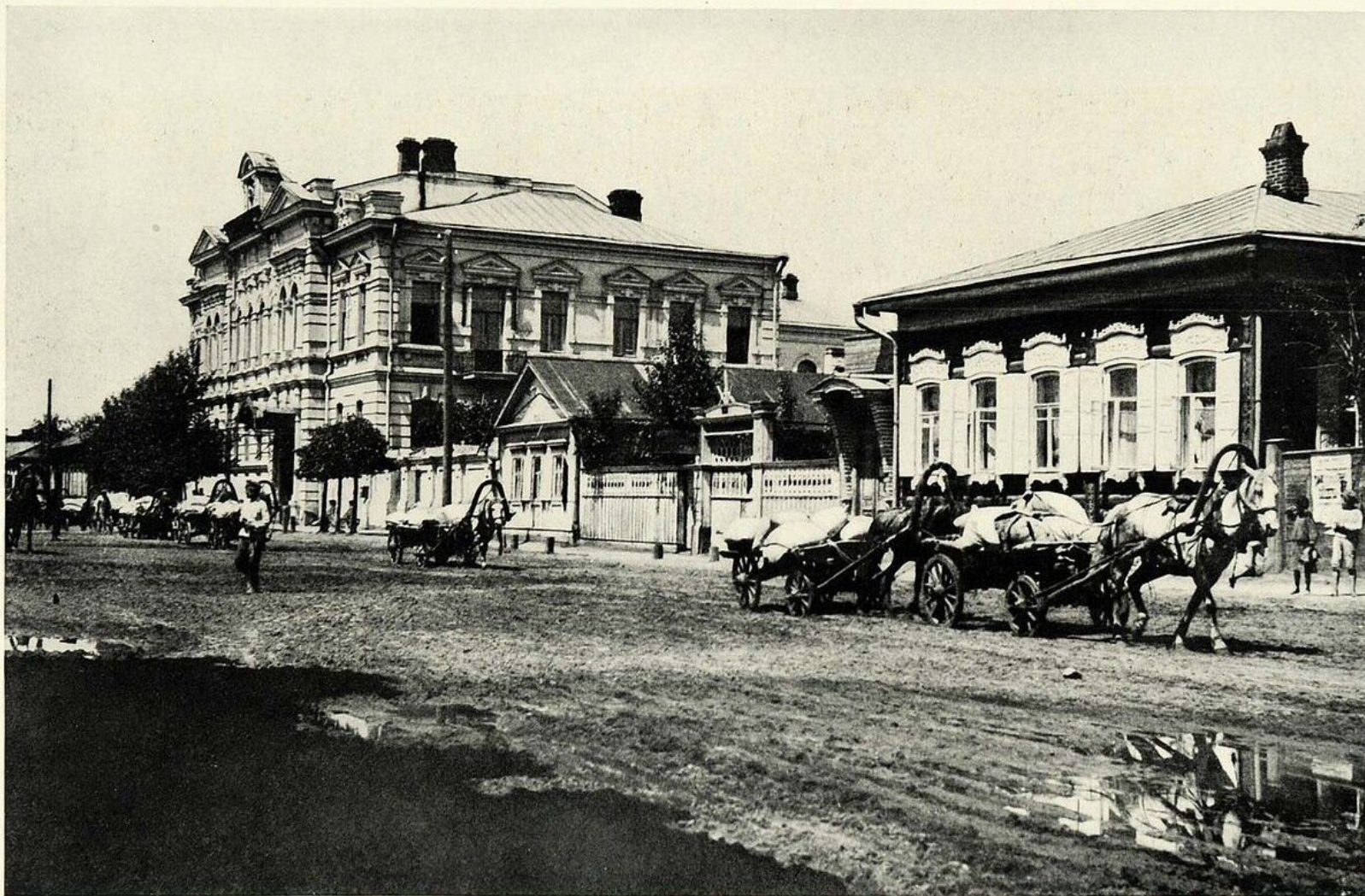
HAULING GOVERNMENT FLOUR IN CHITA