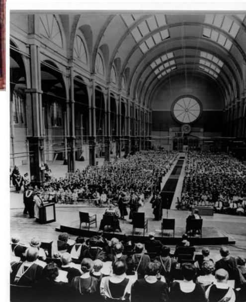
Первый выпуск из Открытого университета