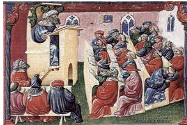
Первые лекции в 13 веке

Впервые в мире университет дистанционного образования был открыт в 1969 году в Великобритании – Открытый Университет Великобритании.