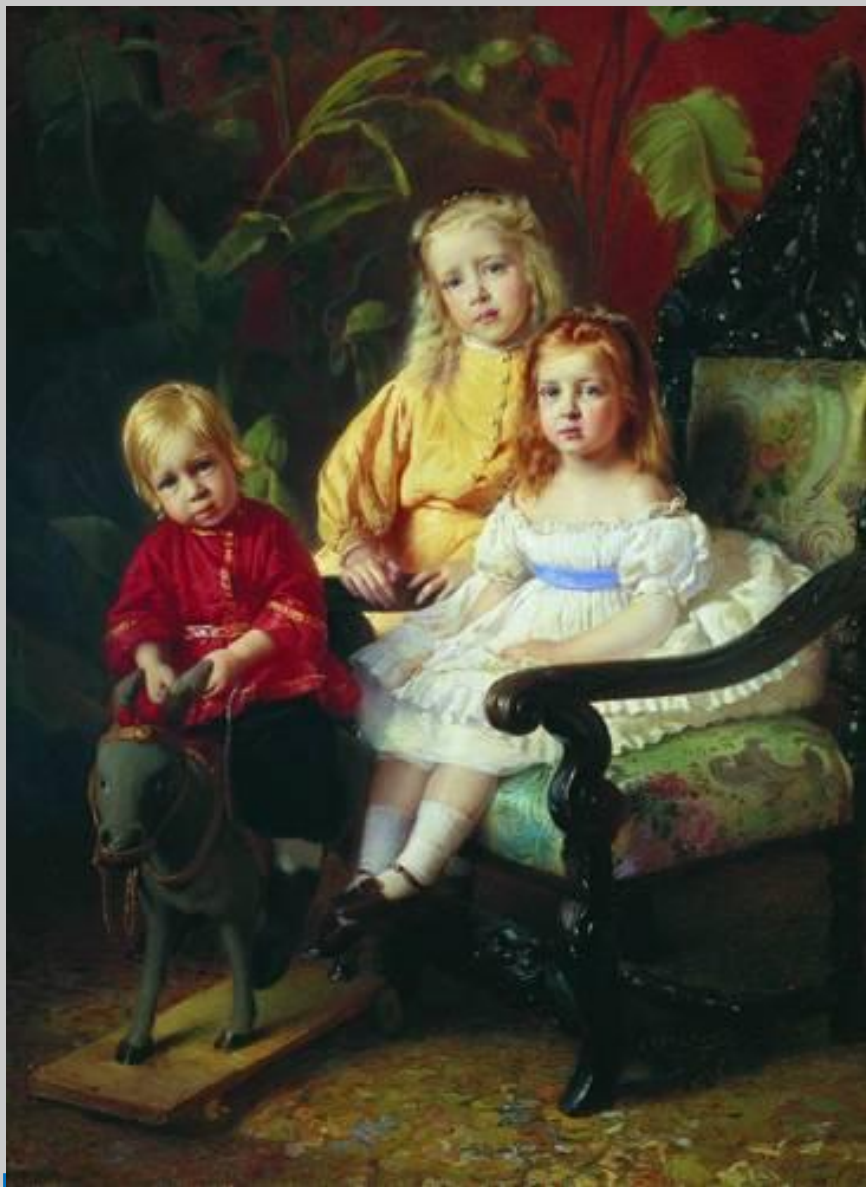
К. Маковский. Портрет детей Стасова