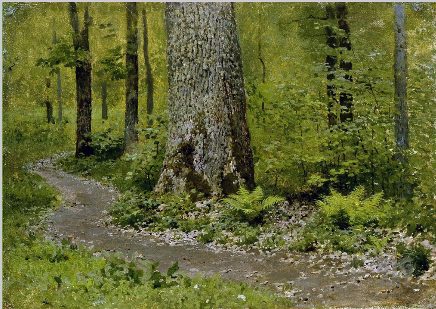
И. И. Левитан. Тропинка в лиственном лесу. Папоротники. Около 1895