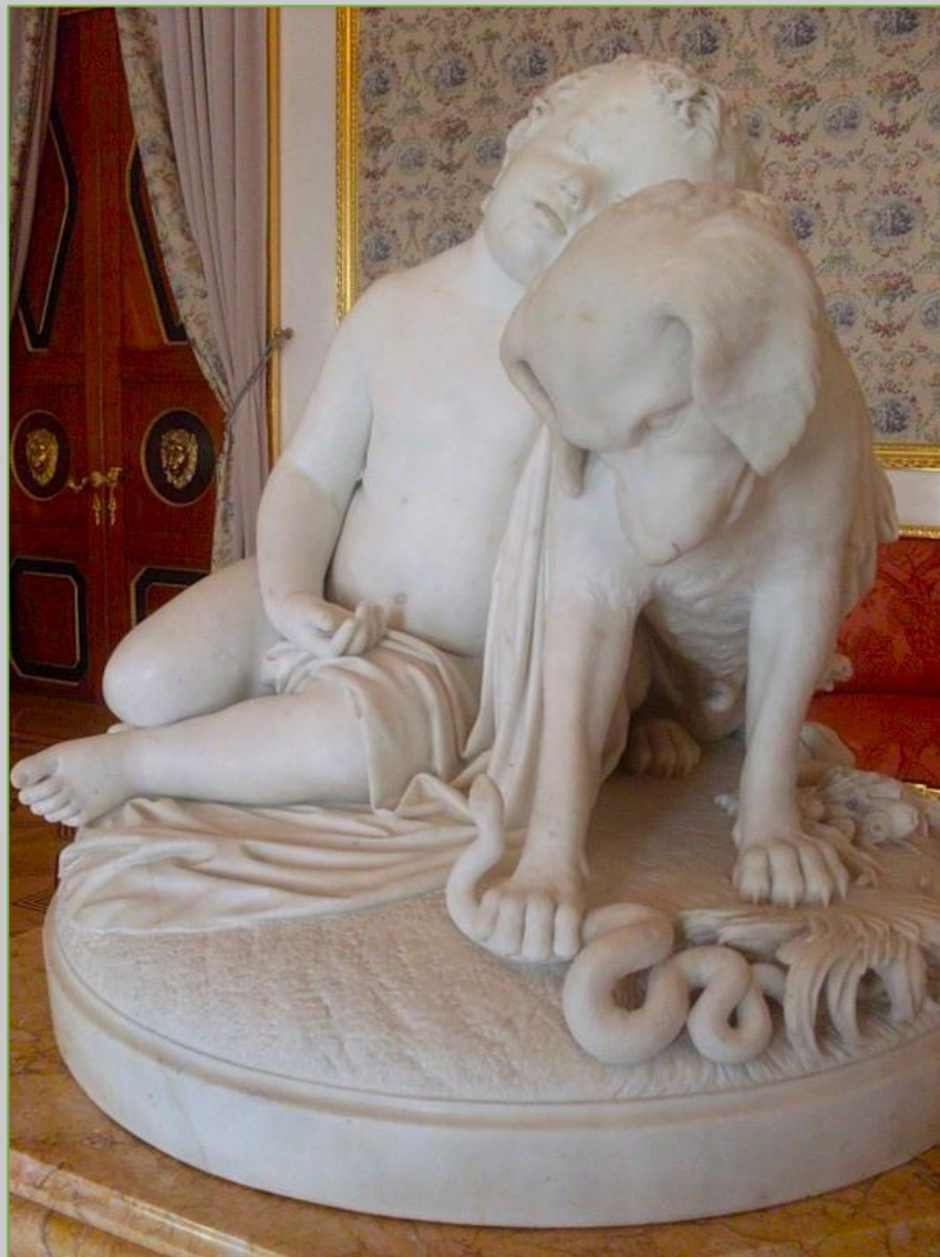
Джозуэ Мели. Преданность. 1854