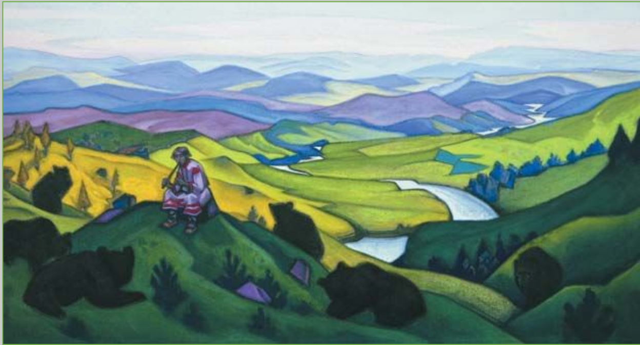
Н. К. Рерих. Человечьи праотцы (Чара звериная). 1943