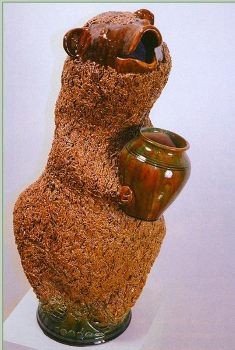
С. И. Поляков. Скульптура «Медведь». Скопин, Рязанская обл. 1994