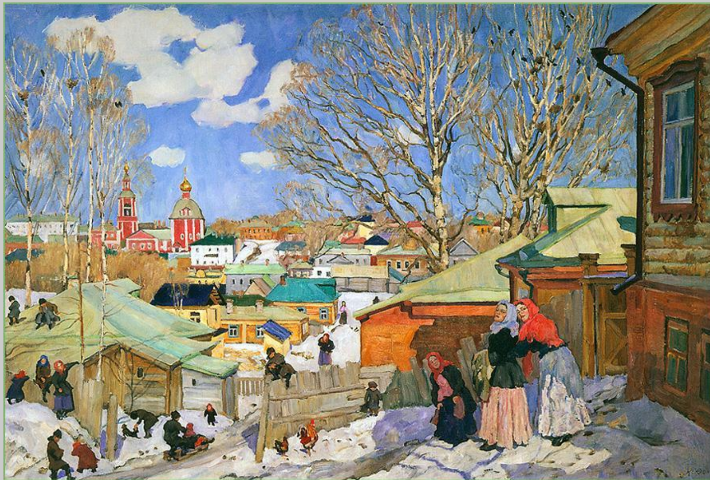
К. Ф. Юон. Весенний солнечный день. Сергиев Пасад. 1903