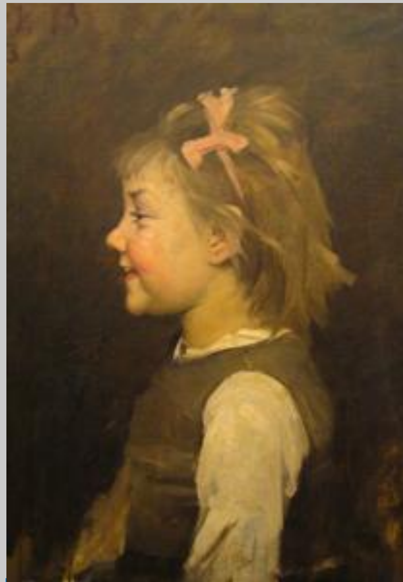
М. К. Башкирцева. Три улыбки. Девочка