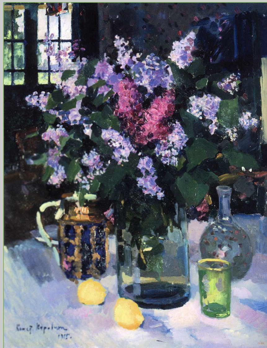
К. А. Коровин. Сирень. 1915