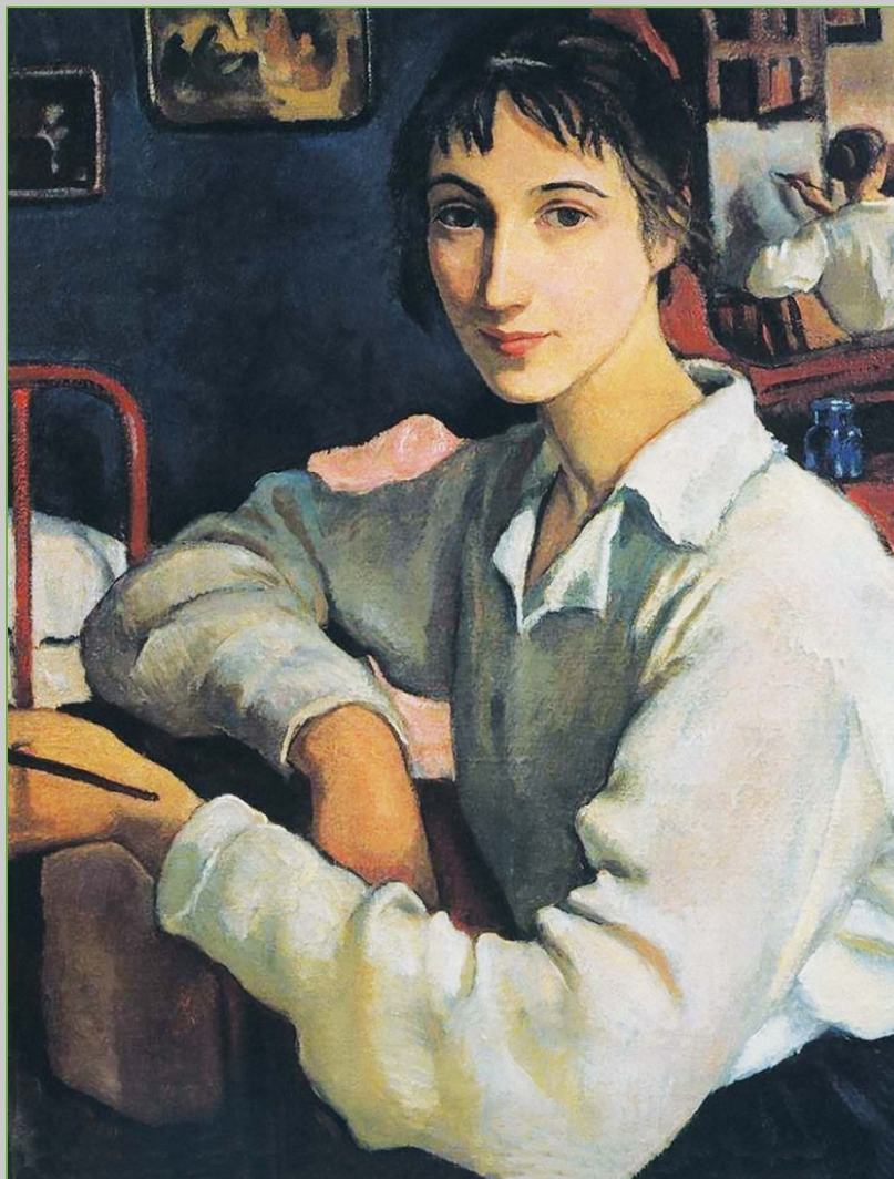
З. Е. Серебрякова. Автопортрет в белой кофточке. 1923