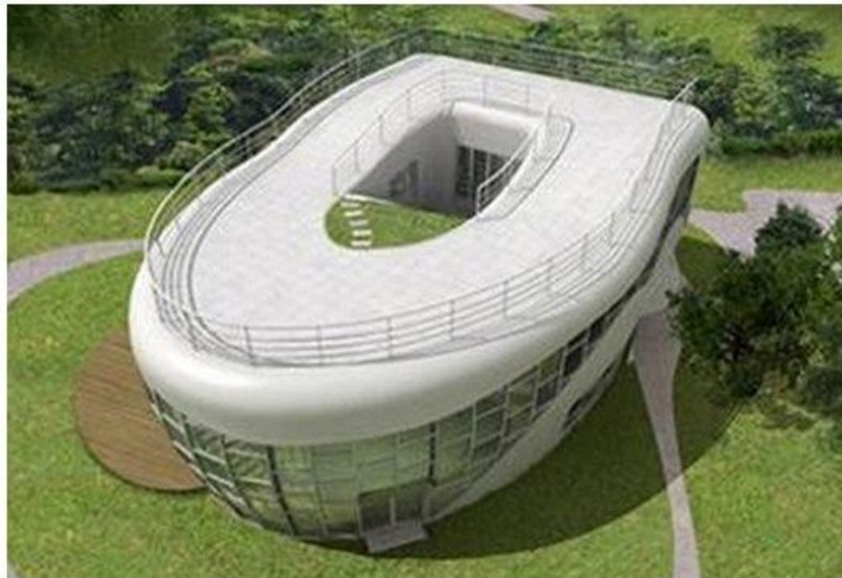
Наewoojae (Дом-унитаз) в Южной Корее. Архитектор Сим Дже-дук.. Непривлекательная форма здания.