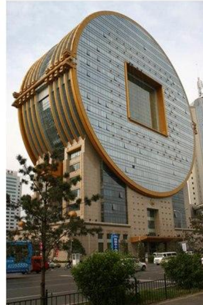
Офисное здание The Fang Yuan Building, Шеньян, Ляонинг. Дизайнером сооружения стал CY Lee, объединивший в своем проекте внешний вид старой китайской монеты с квадратными вырезами и дизайн современного офисного здания. Входит в топ «Самых уродливых зданий в мире». Несуразная форма. Сочетание несочетемого.