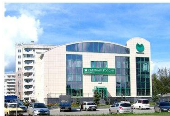
Здание Сбербанка в городе Ачинск