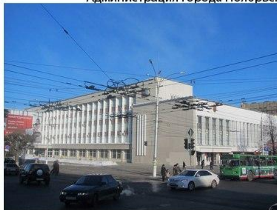
Администрация города Киров