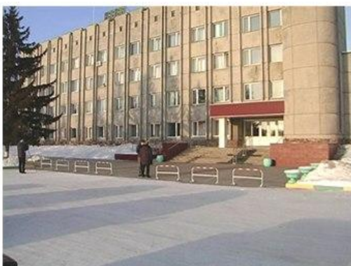
Администрация города Назарово