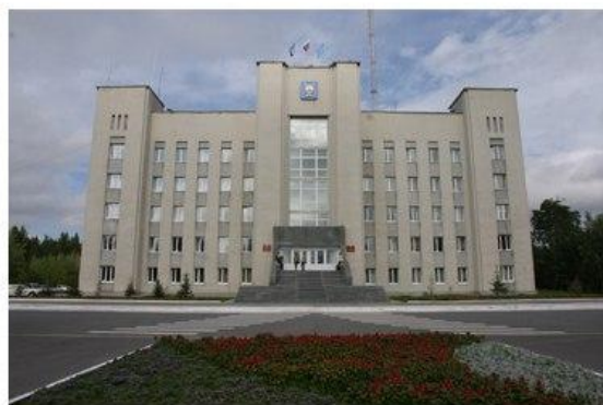
Администрация города Ноябрьск