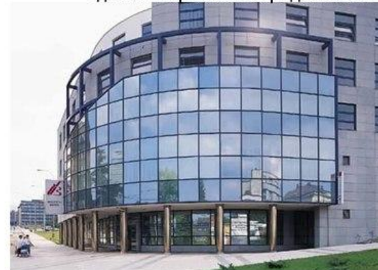
Административное здание в городе Минск