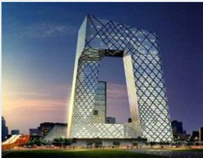
Здание центрального телевидения Китая), 2004 — 09