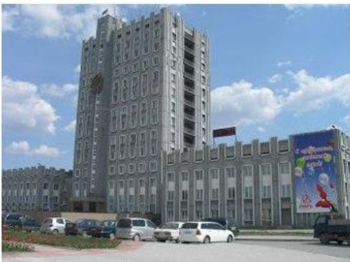
Администрация города Ачинск

«ТИПИЧНЫЕ» фасады. Сплошная «ШТАМПОВКА» однообразных элементов. Ничем не привлекающий образ зданий.