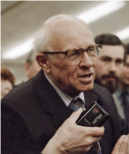
Академик А. Д. Сахаров, сторонник запрещения ядерных испытаний