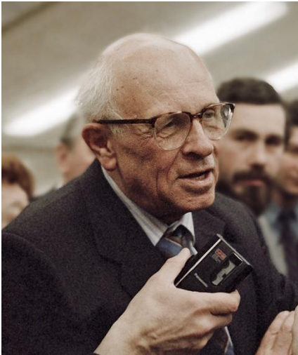
Академик А. Д. Сахаров, сторонник запрещения ядерных испытаний