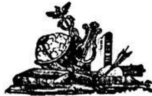
С. Петербургской Императорской Академии наукъ.