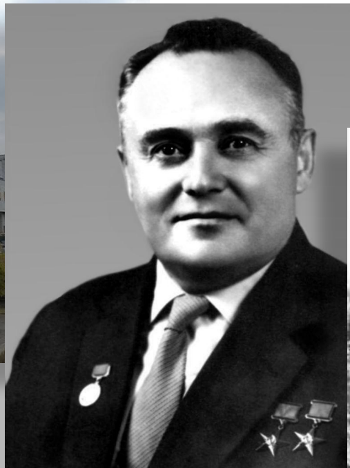
Академик А. Н. Колмогоров