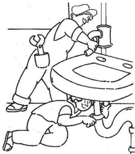
Сантехник Человек - техника