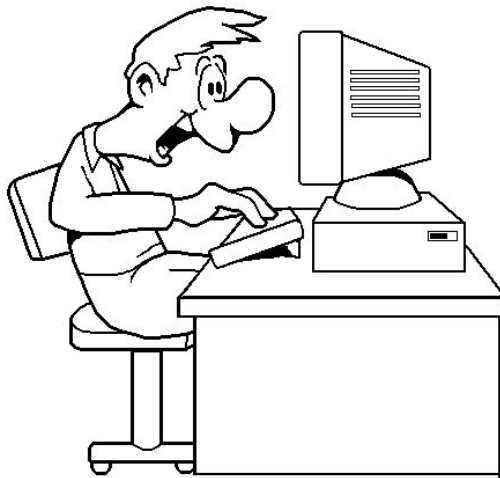
Программист Человек - знаковая система