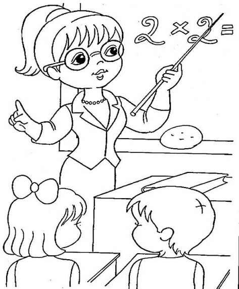
Учитель Человек - человек