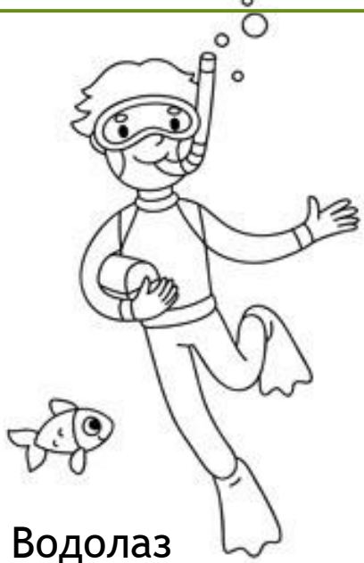
Водолаз Человек - природа