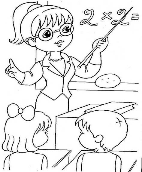
Учитель Человек - человек