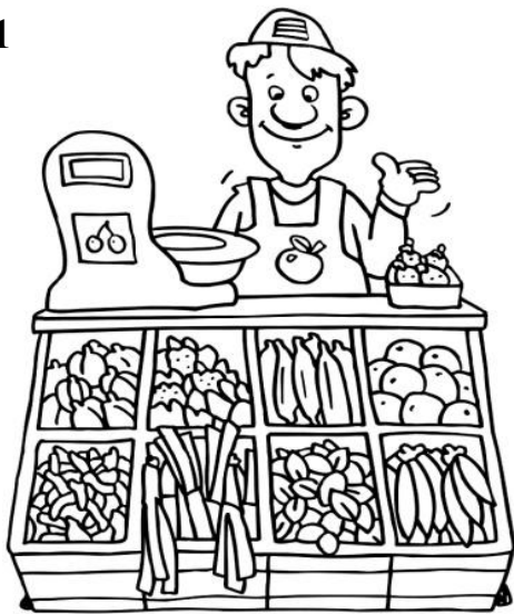
Продавец Человек - человек