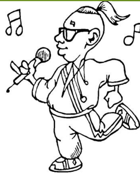
Певец Человек - художественный образ