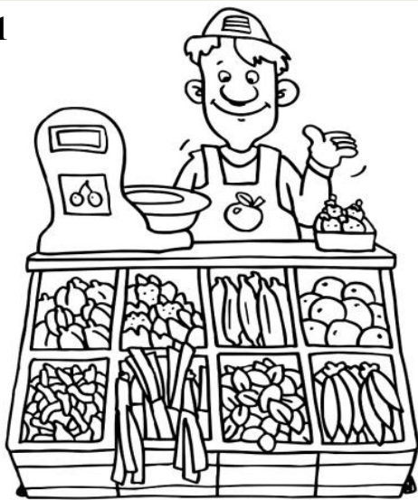
Продавец Человек - человек