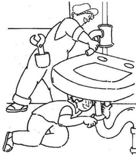
Сантехник Человек - техника