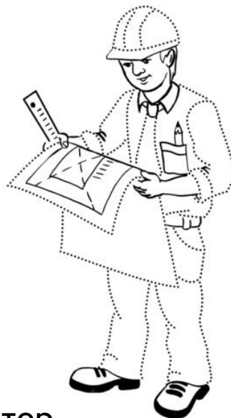
Архитектор Человек - знаковая система