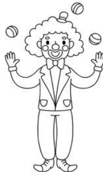
Клоун Человек - художественный образ