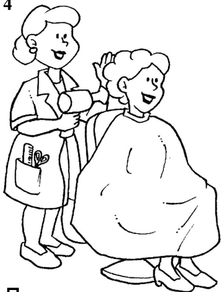
Парикмахер Человек - человек