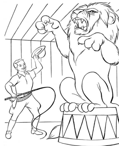
Дрессировщик Человек - природа