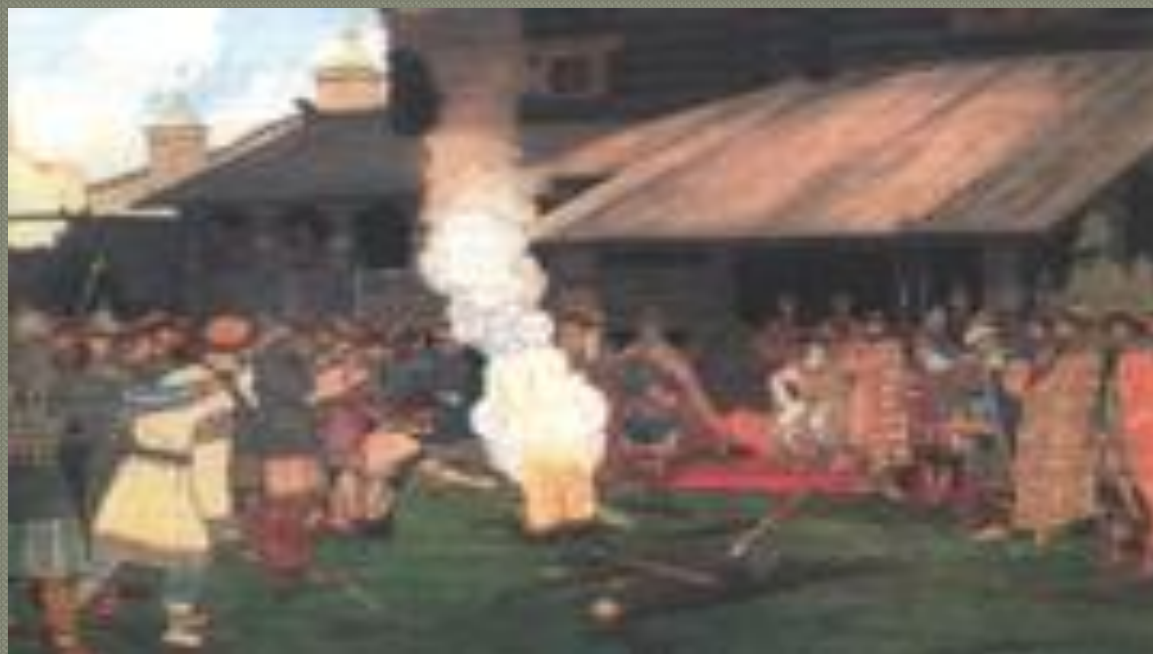
Суд на Руси