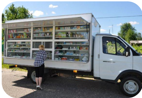
передвижной аптечный пункт