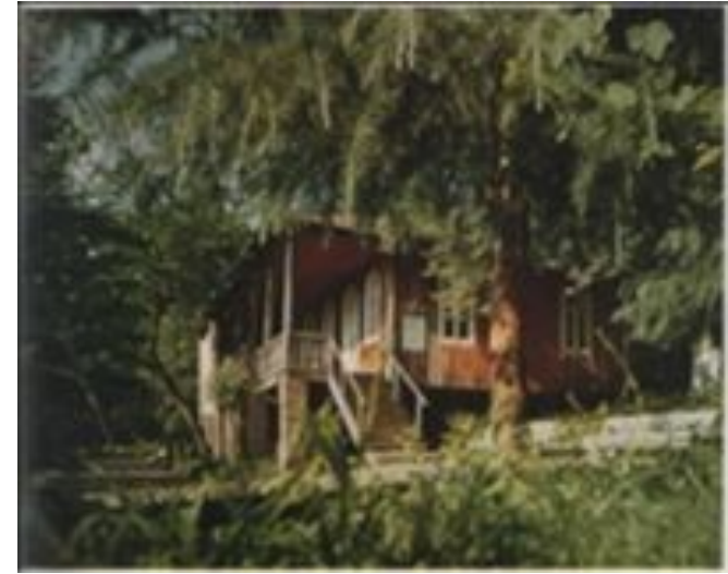
Дом Маяковских в Багдади