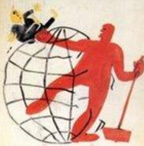
2. ОЧИЩАЯ РЕВУЛЮЦИЯ