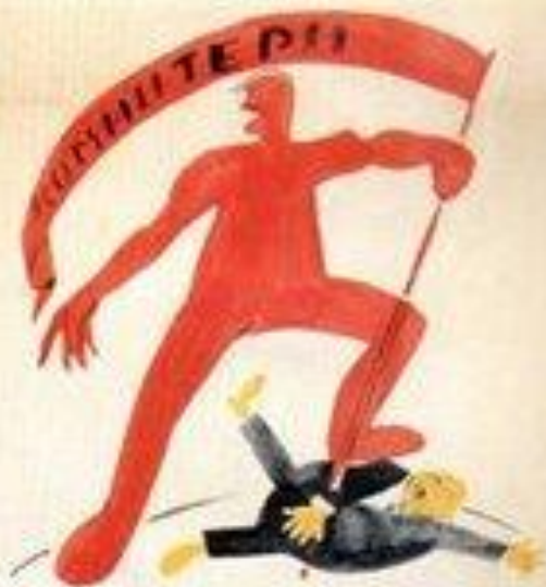
4. В ЕДИНУЮ НОГУ В СЕРДЦЕ СТОИТ

«Ешь ананасы, рябчиков жуй, день твой последний приходит, буржуй!»