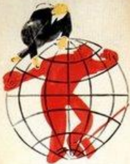
1. МЫЕ СТОИТ НА БУРЖУАХ