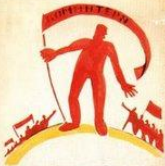
3. КОММУНИСТЫ: НИКОГДА НЕ ПОЗВОЛЯТ БУРЖУАМ ТОЛЬКО ВОССТАНИЕ СДЕЛАТЬ