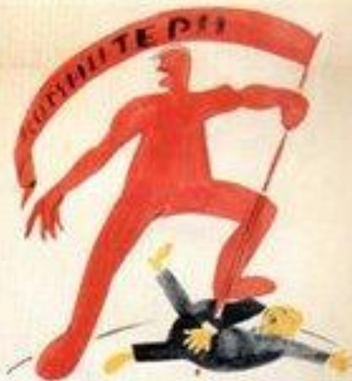
4. В ЕДИНУЮ ЛИНЮ В СЕРВИС СТОИТ

«Ешь ананасы, рябчиков жуй, день твой последний приходит, буржуй!»