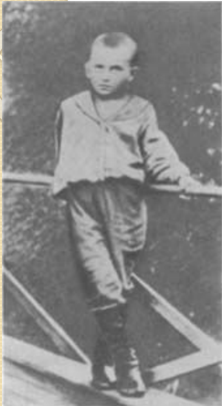
Володя Маяковский 1900 год

«В июле у нас в семье большой праздник. Володя родился в день рождения отца — 7 июля (по новому стилю 19 июля) 1893 года, — поэтому его и назвали Владимиром».