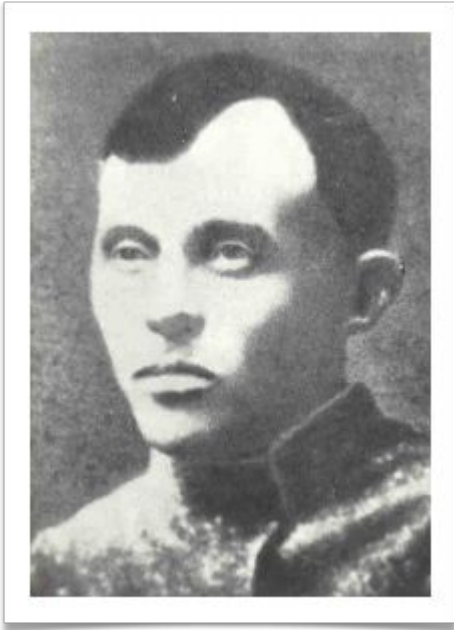
Александр Степанович Антонов

Программа восставших крестьян была принята крестьянским губернским съездом в Тамбове: