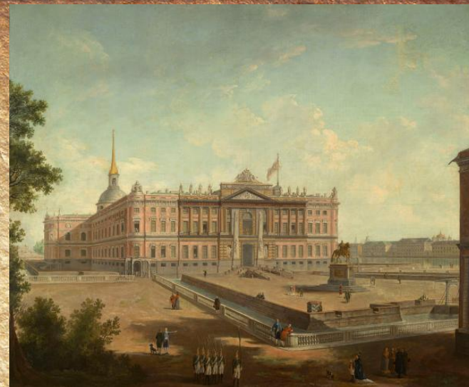
Вид на Михайловский замок и площадь Коннетабля в Петербурге