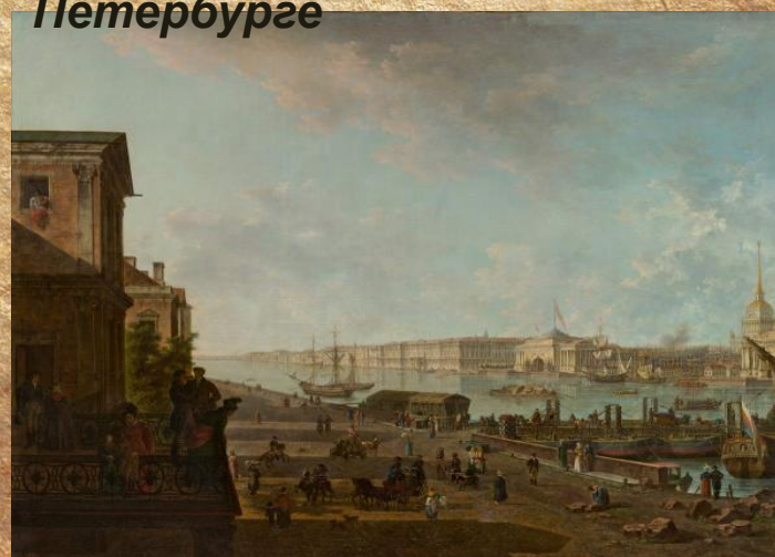
Вид на Адмиралтейство и Дворцовую набережную