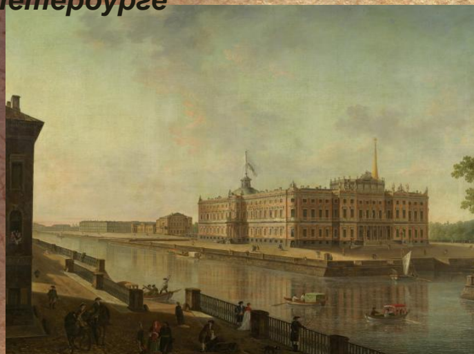
Вид на Михайловский замок в Петербурге со стороны