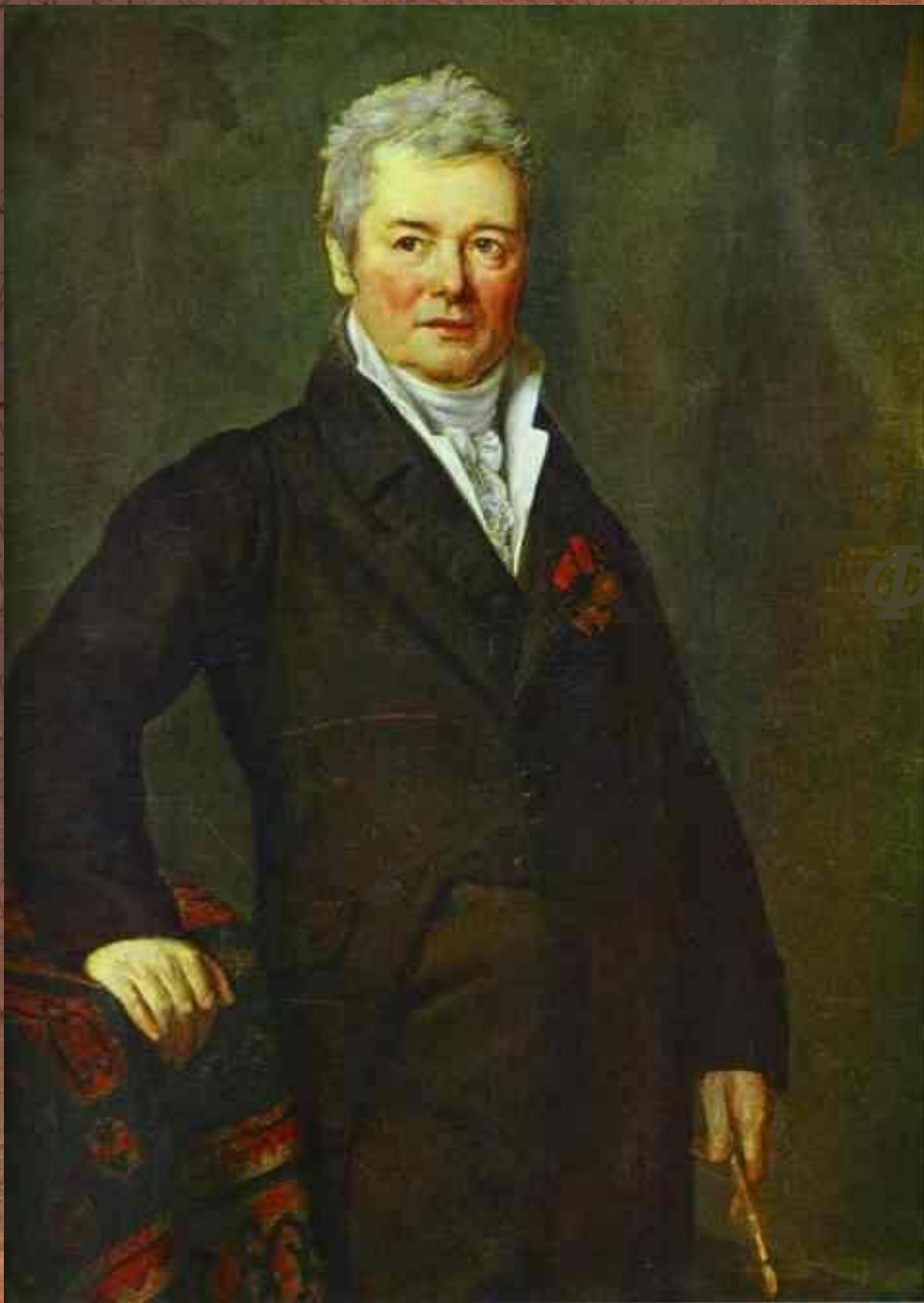
Алексеев Фёдор Яковлевич