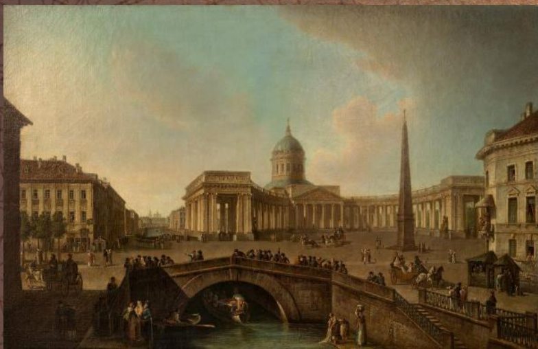
Вид на Казанский собор в Петербурге