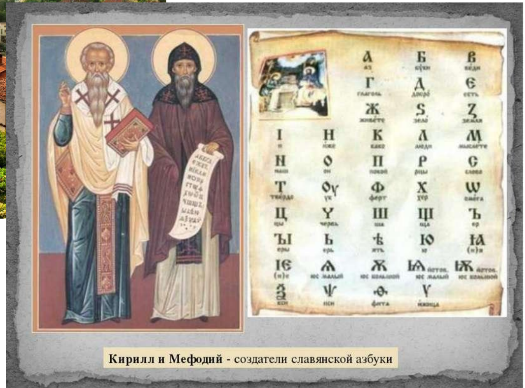
Кирилл и Мефодий - создатели славянской азбуки