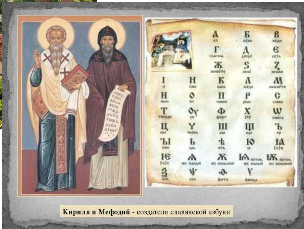
Кирилл и Мефодий - создатели славянской азбуки