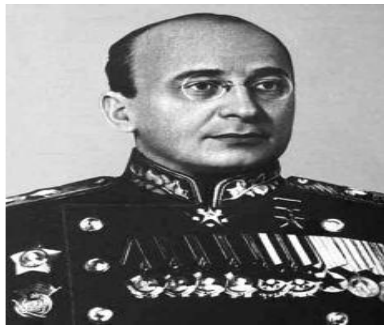
Л.Берия (1899 – 1953)