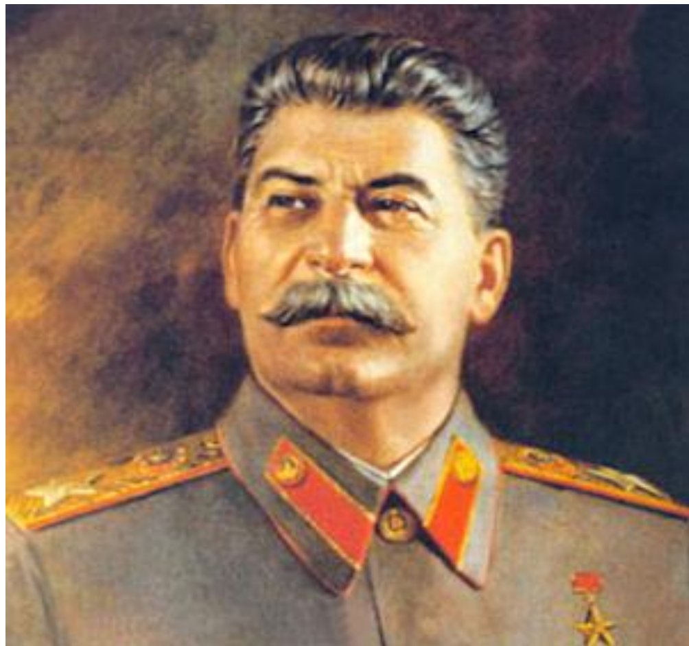
И.В.Сталин (1878 – 1953)